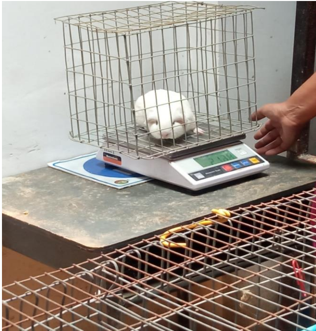
Figura 3 Tomando datos de ganancia de peso.