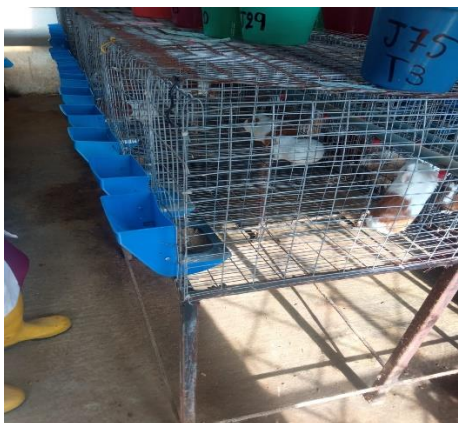
Figura 1 Jaulas con animales de tratamiento 1, 2 y 3 respectivamente