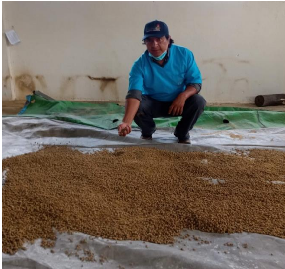
Figura 7 Obtención del producto final (alimento para cuyes)