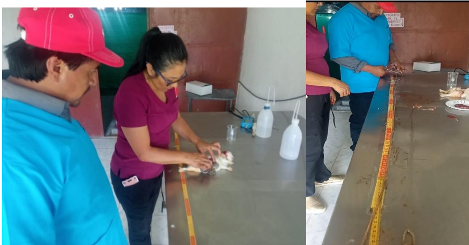
Figura 4 Tomando muestras de órganos para análisis.