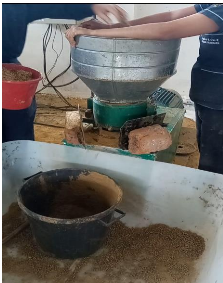
Figura 6 Proceso de elaboración de balanceado con diferentes tamaños de partícula.