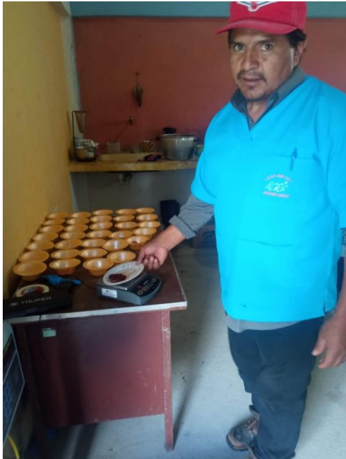
Figura 5 Muestra y pesado de órganos.