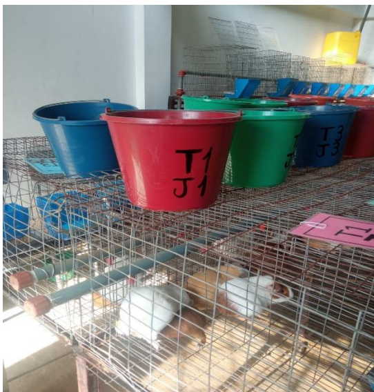
Figura 2 Jaulas con animales de tratamiento 1, 2 y 3 respectivamente