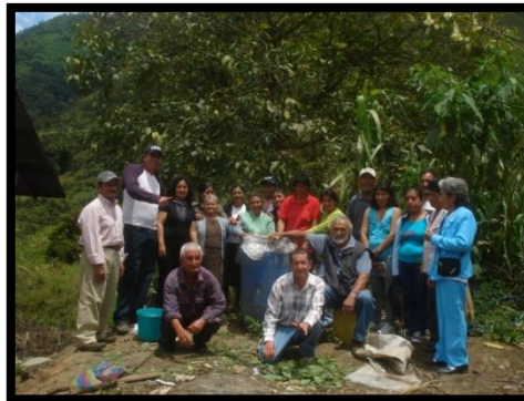
TRABAJO CON ASOCIACIONES DEL RECINTO MACUCHI 2019