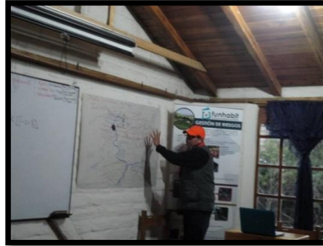
ANALISIS DE TERRITORIO CON ACTORES SOCIALES 2019