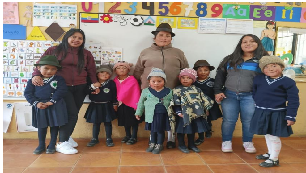
Elaborado por: Las Autoras