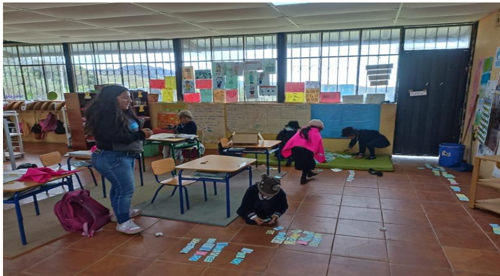
Elaborado por: Las Autoras