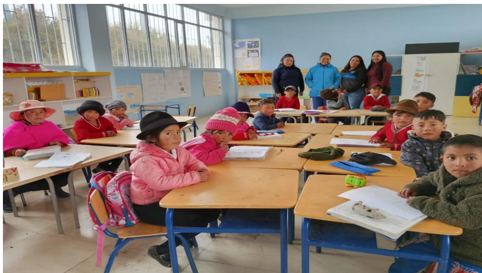
Elaborado por: Las Autoras