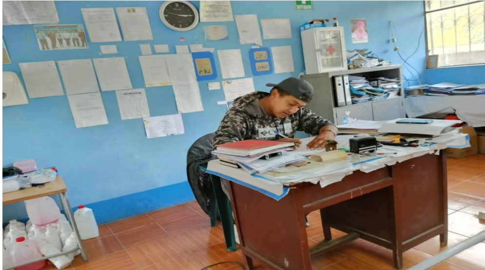
Elaborado por: Las Autoras