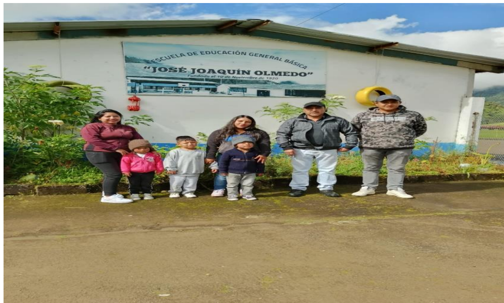
Elaborado por: Las Autoras