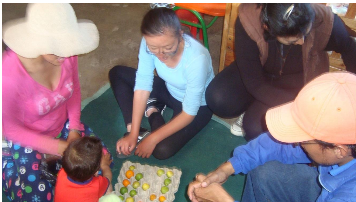
Desarrollando la área cognitiva a través del taller de estimulación con el coordinador y los padres