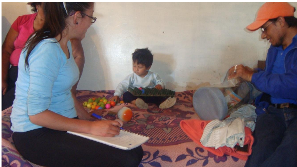
Realizando el taller en conjunto con el coordinador y los padres de familia del CNH.