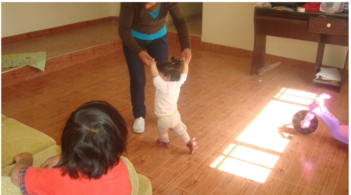
Afianzando la aplicación del taller con la ejecución de cada uno de los padres