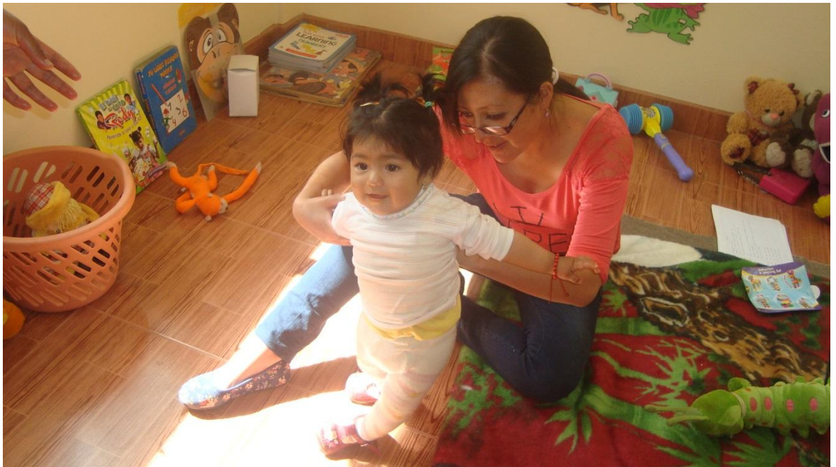
Trabajando con el párvulo y fortaleciendo sus capacidades motrices y afectivas.