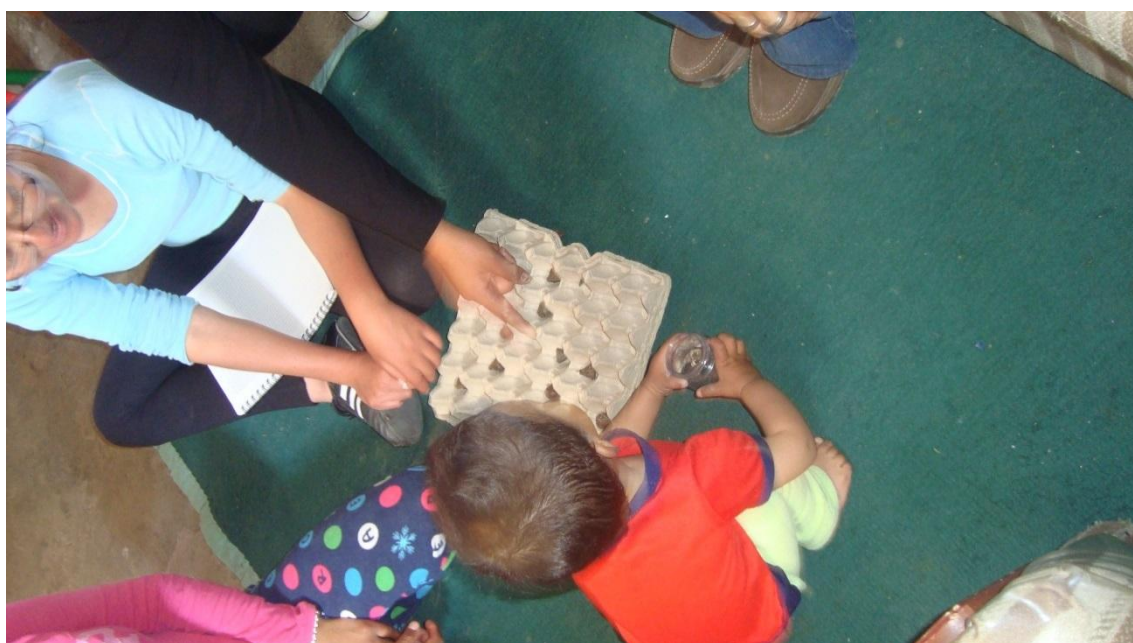
Fortaleciendo el taller con los niños para afianzar su conocimiento