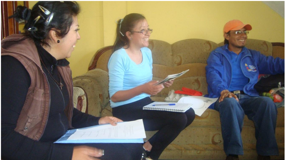
Realizando la aplicación de las encuestas a los padres de familia del CNH de la Parroquia 11 de Noviembre.