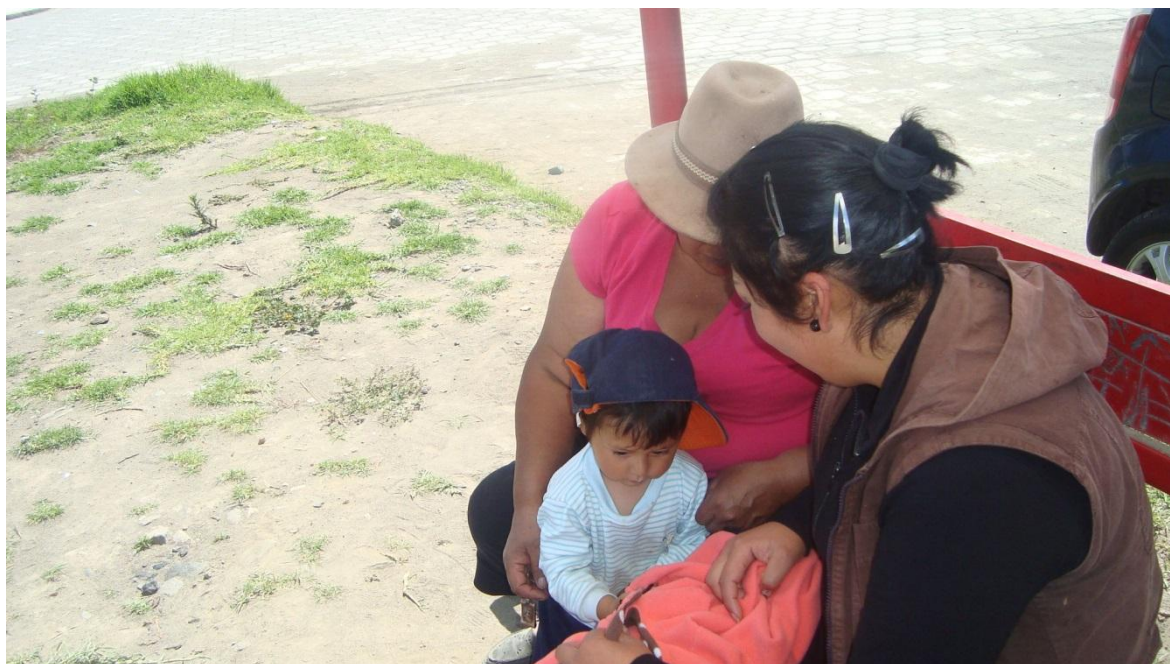
Desarrollando las actividades de estimulación con cada niño y los padres en exterior.