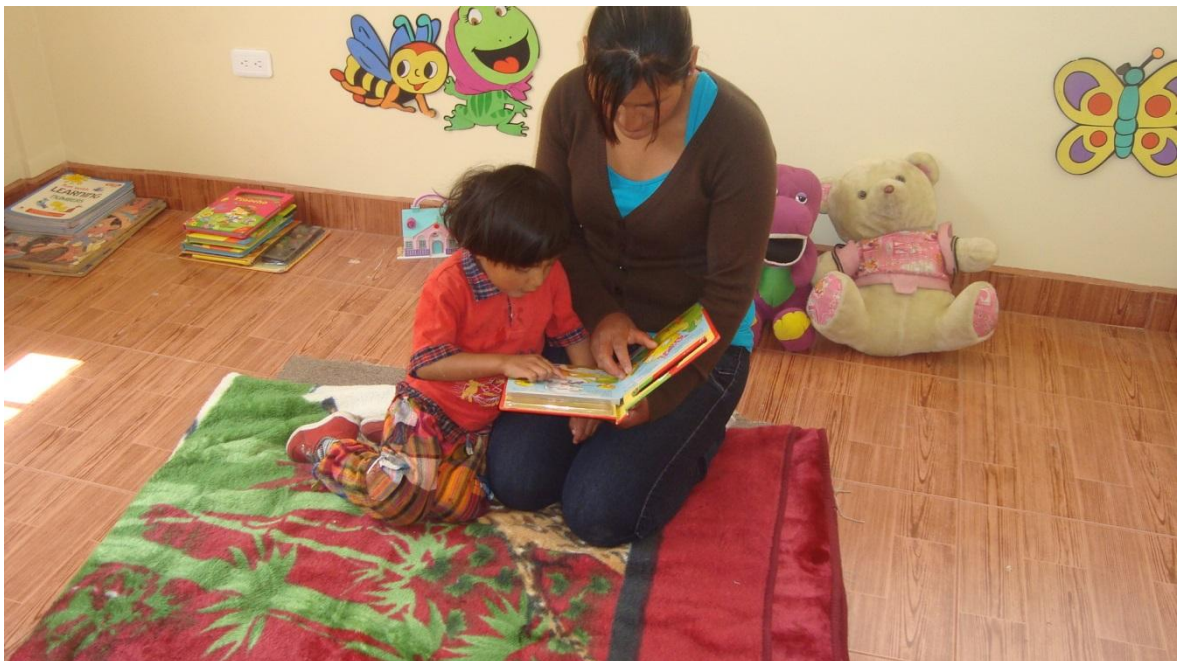
Trabajando con los padres de familia en la ejecución del taller