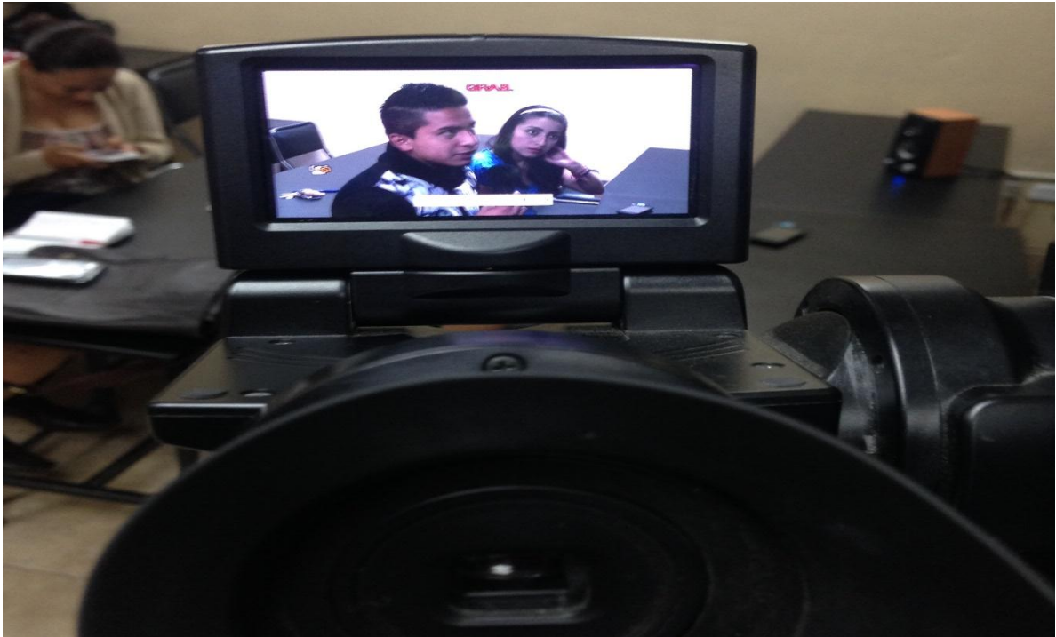
Foto: Grabación del grupo focal para sustento audiovisual de las intervenciones.