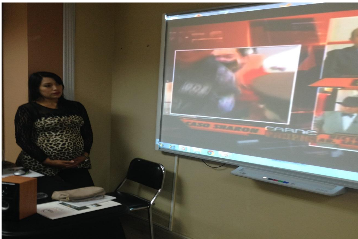
Foto: Presenta un extracto del programa En Carne Propia al grupo Focal.