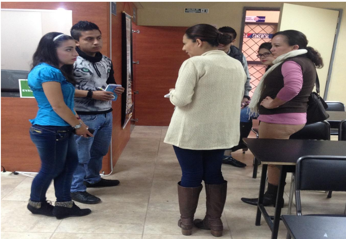
Foto: Despejando inquietudes y aceptando sugerencias frente al tema.