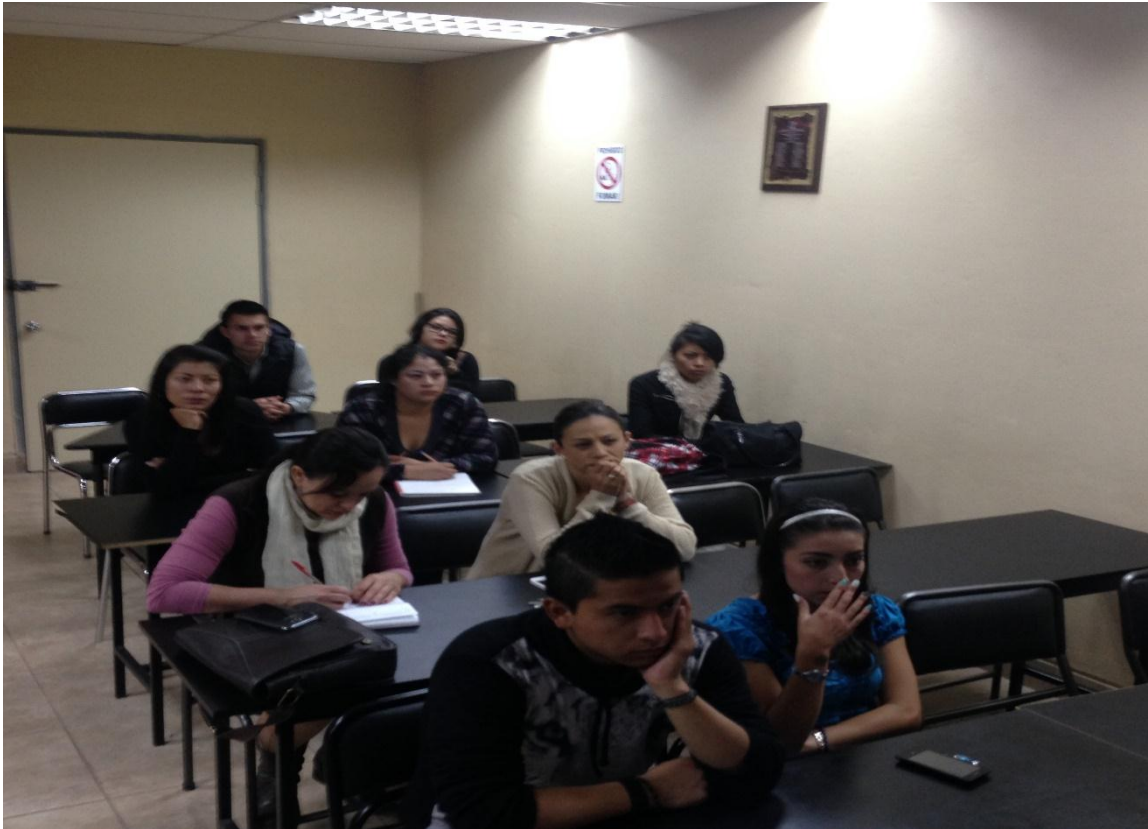
Foto: Reacción en rostros al mirar escenas del programa En Carne Propia.