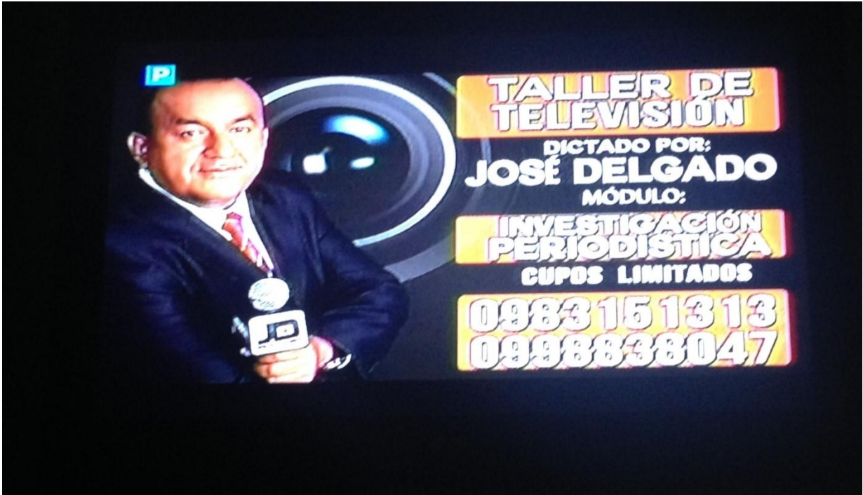
Foto: Publicidad que emite durante su programación.