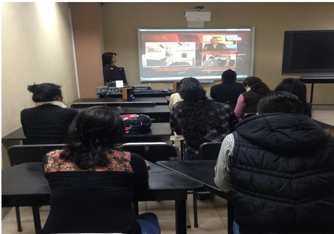
Foto: Presentación de video preparado para el grupo focal.