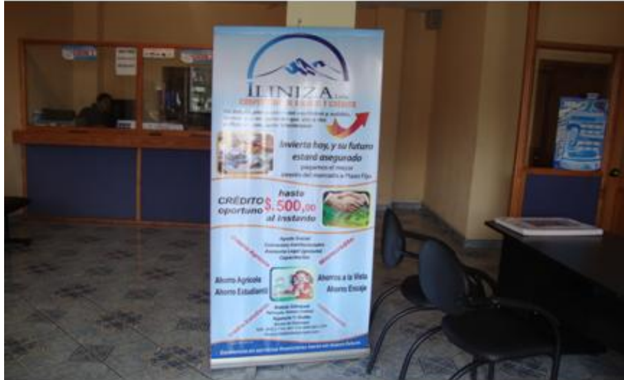
FOTOGRAFÍA No. 06 “PERSONAL DE LA COOPERATIVA DE AHORRO Y CRÉDITO “ILINIZA LTDA.””