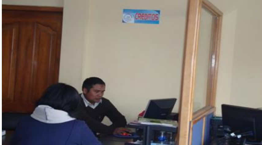
FOTOGRAFÍA No. 04 “CAJAS DE LA COOPERATIVA DE AHORRO Y CRÉDITO “ILINIZA LTDA.””