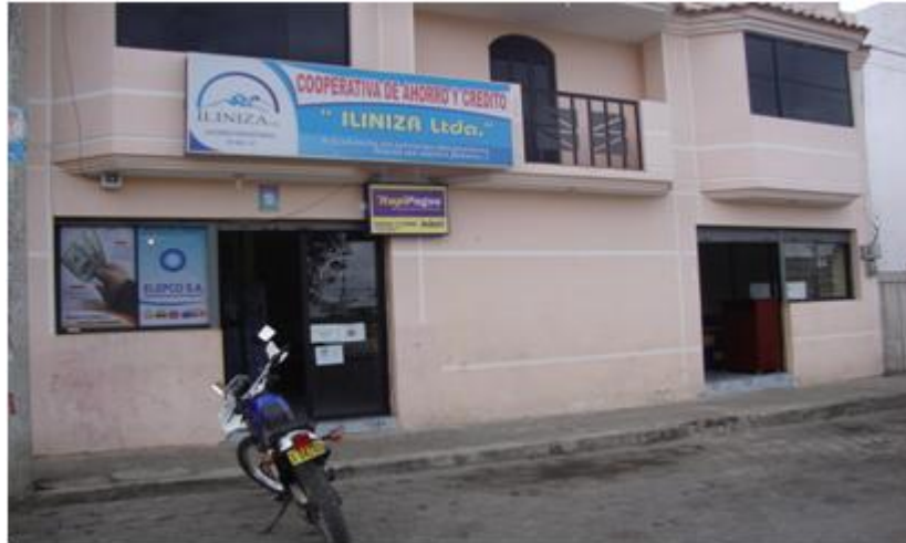
FOTOGRAFÍA No. 02 “ÁREA DE INFORMACIÓN DE LA COOPERATIVA DE AHORRO Y CRÉDITO “ILINIZA LTDA.””