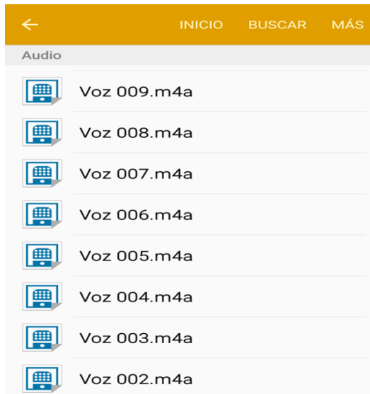
Figura 1. Captura de pantalla de las grabaciones de voz a los entrevistados