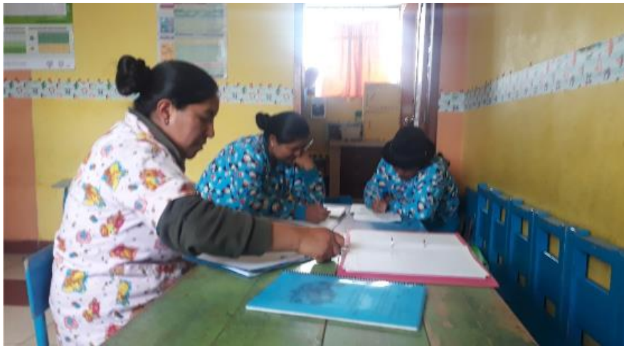
Fotografía 5. Actividad 5 – Planificación de actividades Elaborado por: Jaqueline Tipán