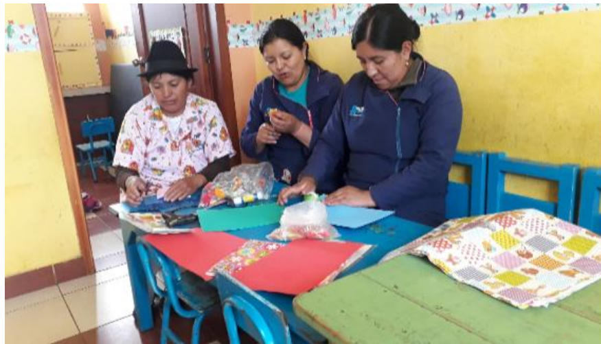
Fotografía 4. Actividad 4 – Elaboración de pictogramas Elaborado por: Jaqueline Tipán