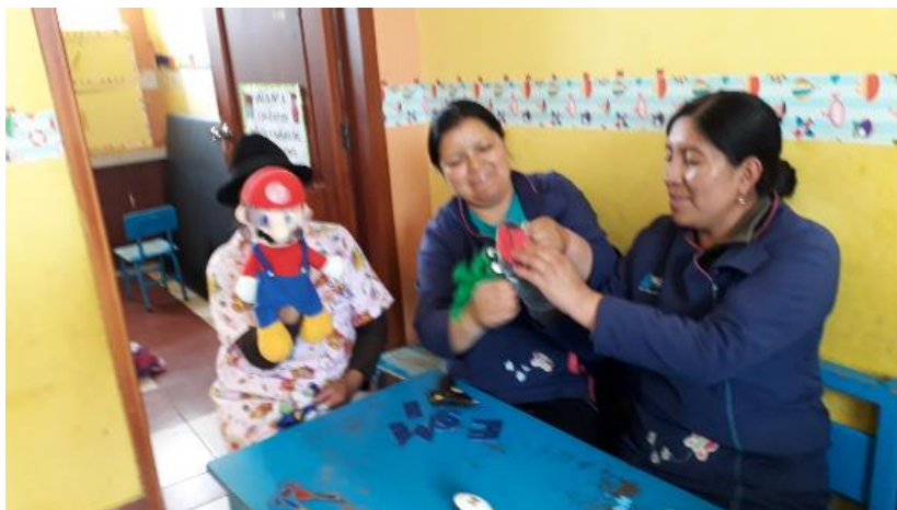
Fotografía 2. Actividad 2 – Elaboración de pictogramas Elaborado por: Jaqueline Tipán