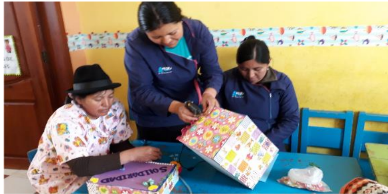
Fotografía 1. Actividad 1 - Elaboración de las cajas Elaborado por: Jaqueline Tipán