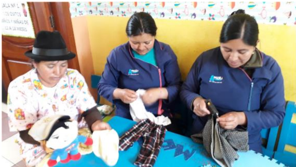
Fotografía 3. Actividad 3 – Elaboración de vestimenta