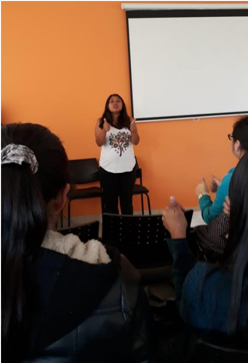
Gráfico N° 9. Aplicación de la propuesta docentes y autoridades I