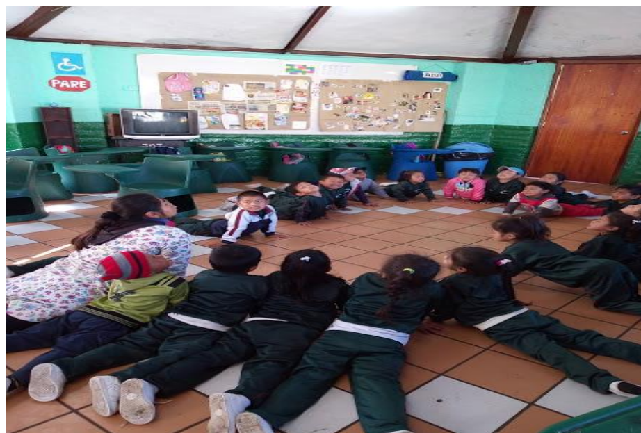
Aplicación de la propuesta IV