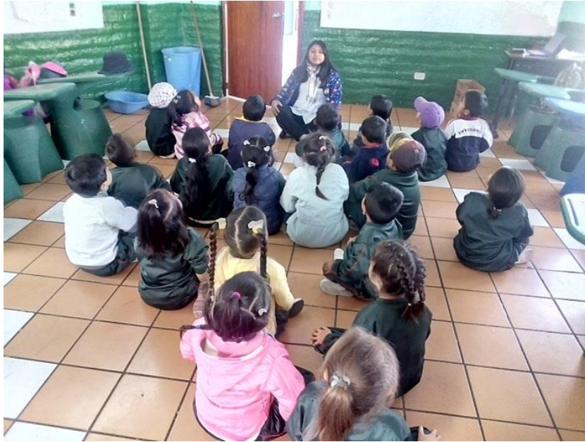
Gráfico N° 2. Aplicación de la propuesta II.