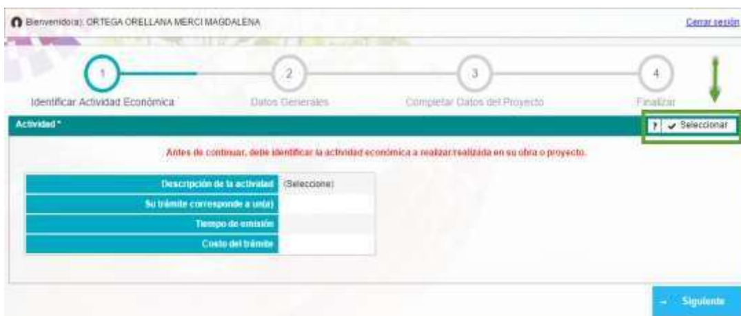
Seleccionar actividad económica