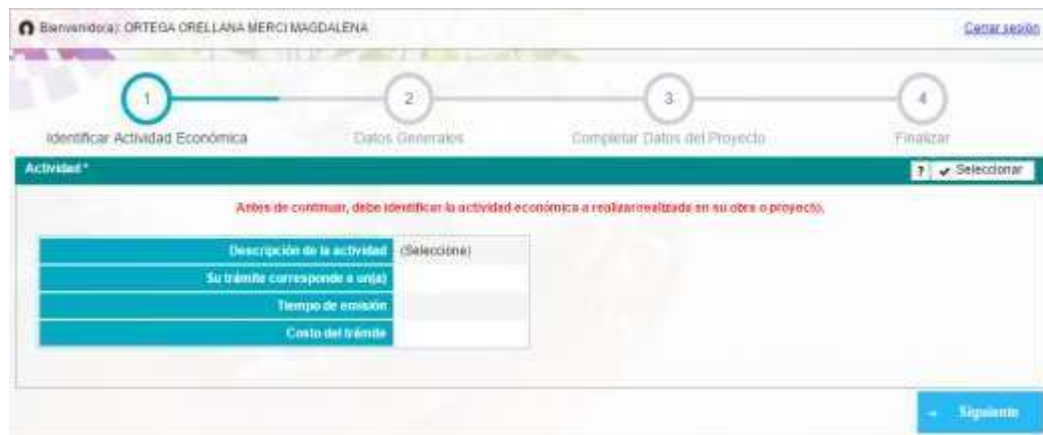
Identificar proyecto, obra o actividad