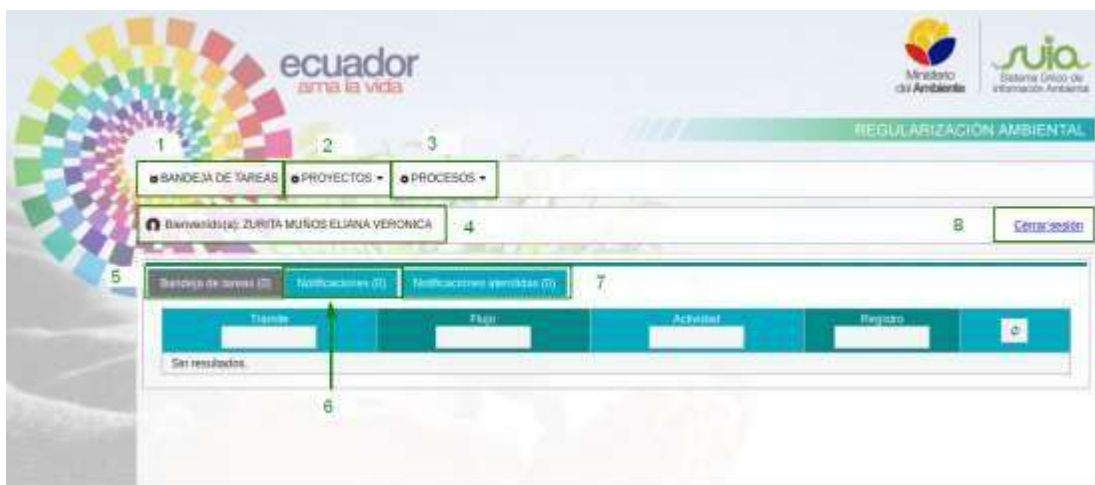
Acceso al sistema