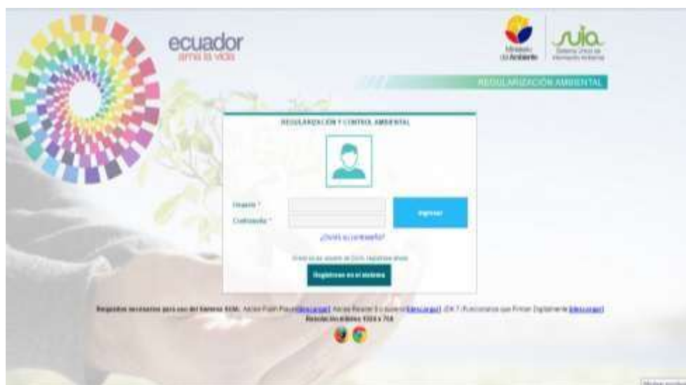
Pantalla Principal del Sistema de Regularización y Control Ambiental