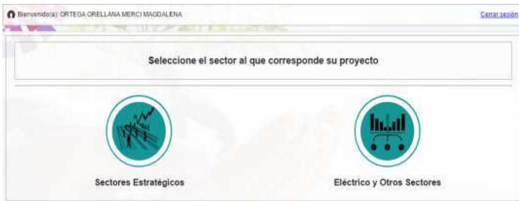
Sectores para el registro de proyectos