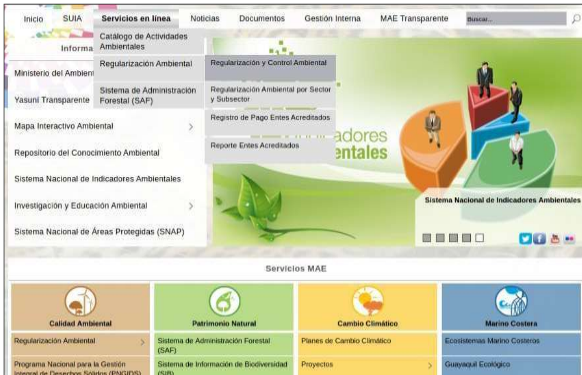
Ingreso al Sistema Único de Información Ambiental

Ingresar a una plataforma digital donde se llenaran los datos importantes de la empresa, institución o a su vez si es una persona natural que hace el trámite.