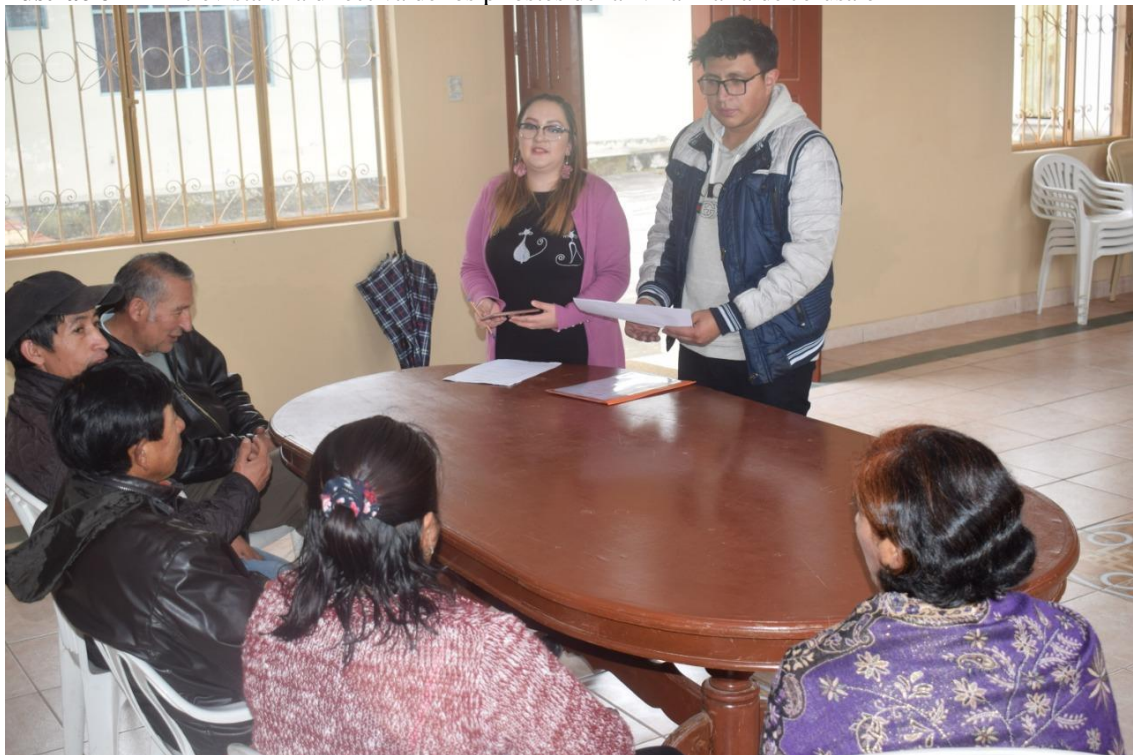
Elaborado por: Los investigadores