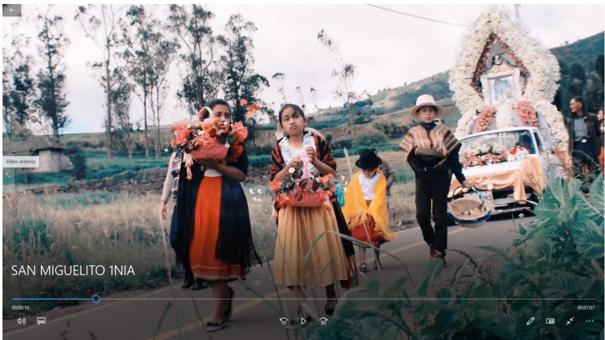
Ilustración 2 desarrollo del video