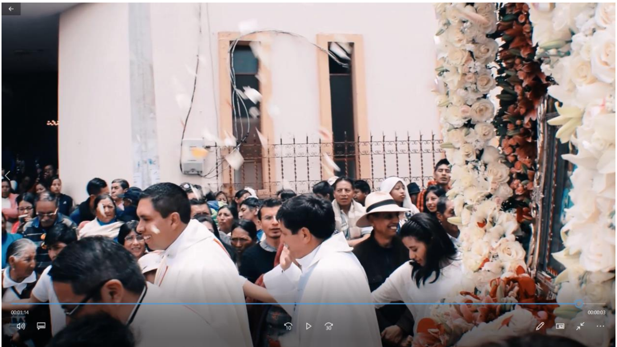
Ilustración 4 cierre del video