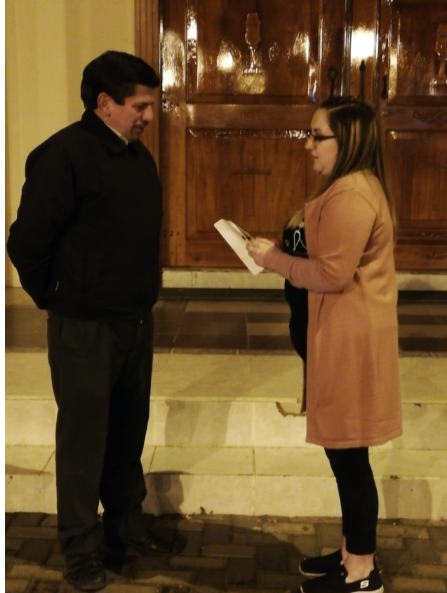
Elaborado por: Los investigadores