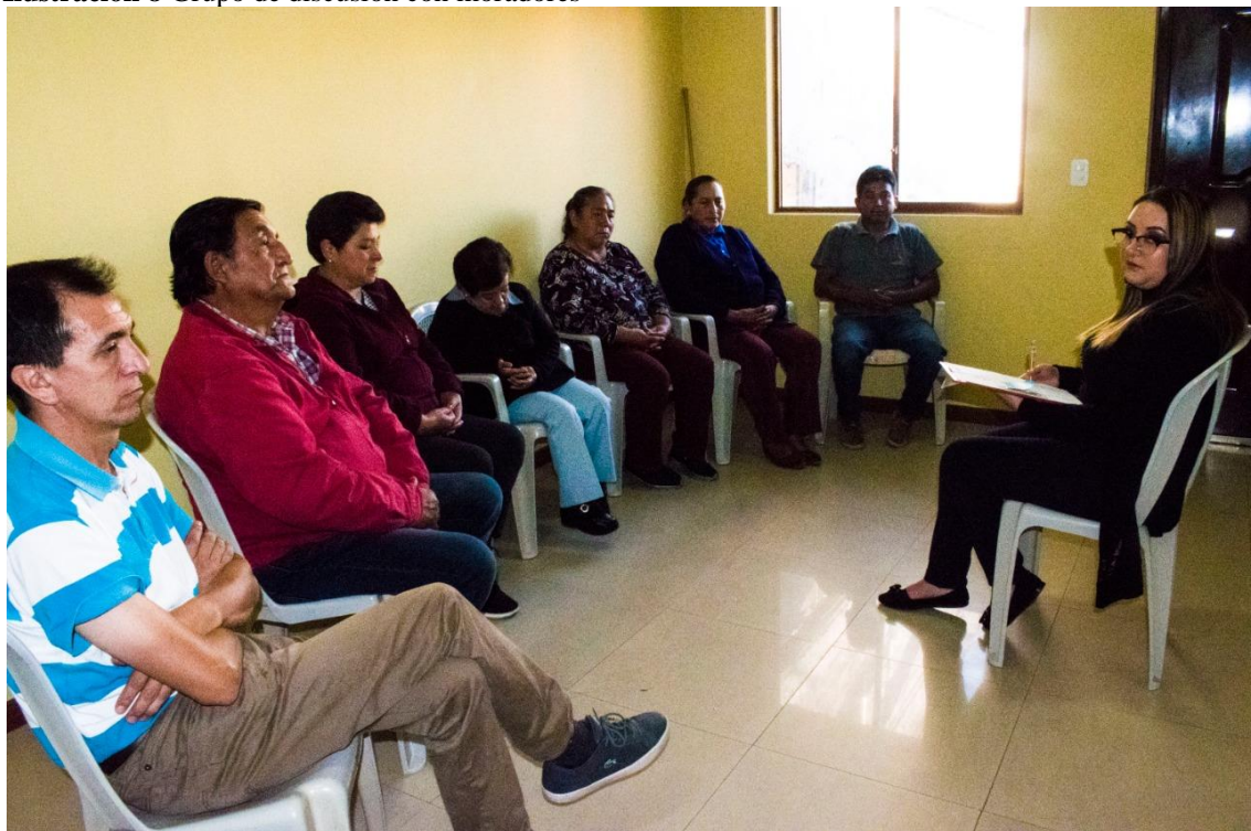
Elaborado por: Los investigadores