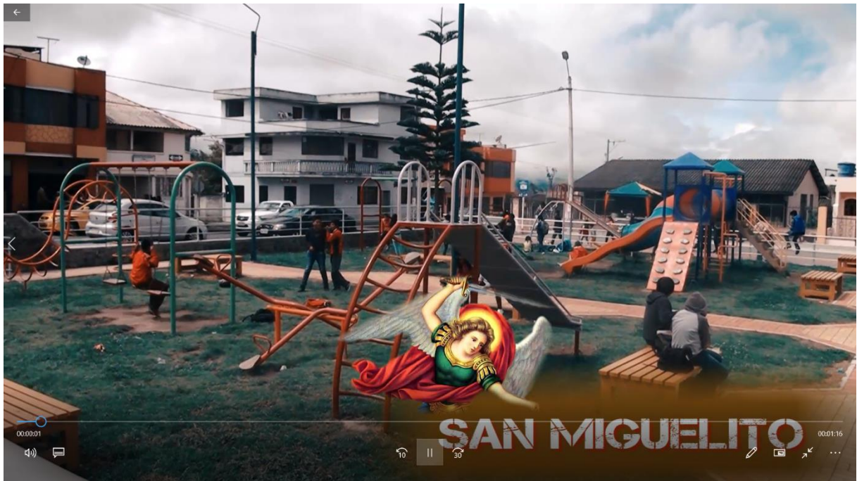
Ilustración 1 Intro del video