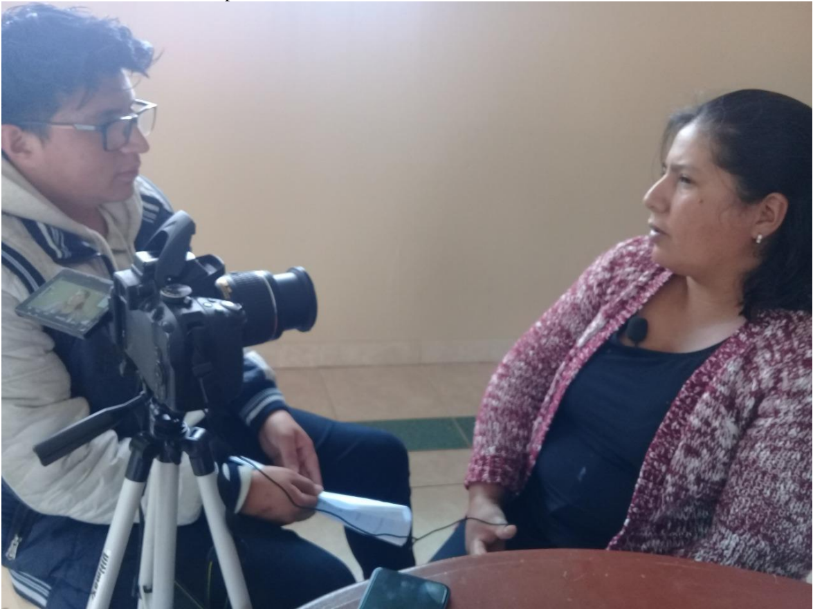
Ilustración 5 Entrevista a los priostes