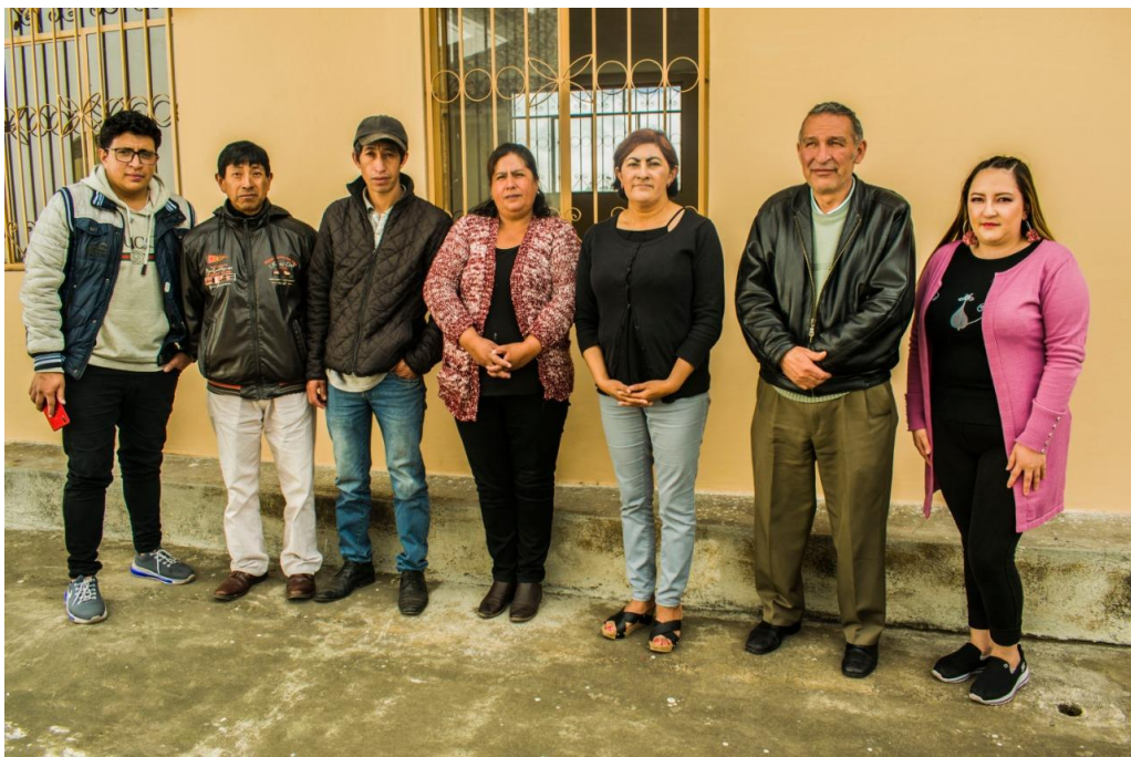
Ilustración 2 Directiva de los priostes de la Niña María de Jerusalén