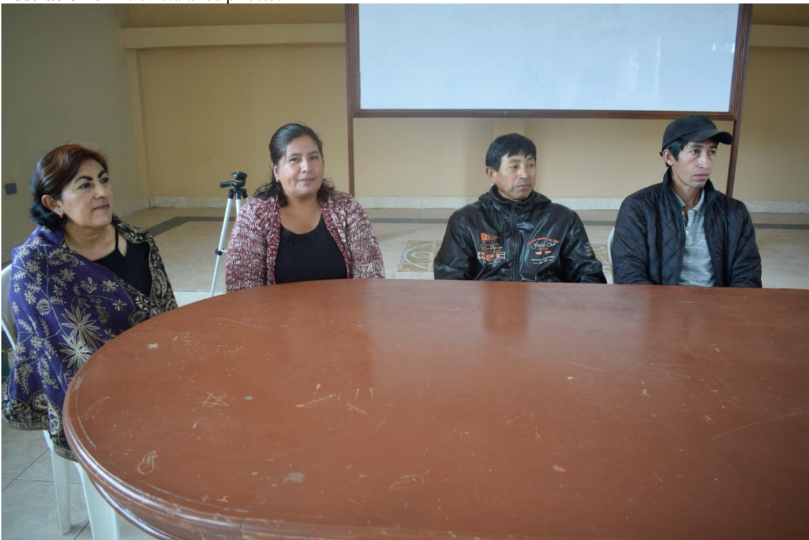
Ilustración 6 Entrevista a los priostes