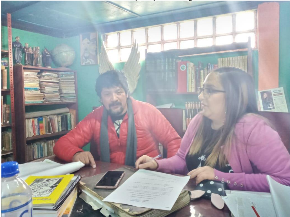
Ilustración 1 Entrevista al historiador de la parroquia San Miguelito