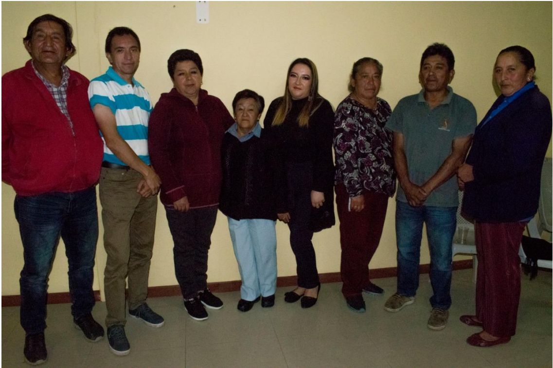
Elaborado por: Los investigadores