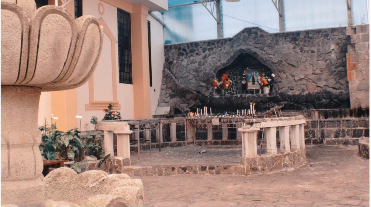
Ilustración 3 desarrollo del video