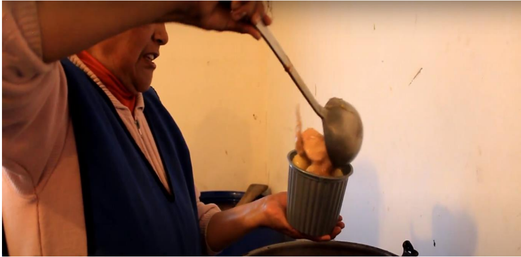
Imagen 15. Cocineros.

Principalmente intervienen la comunidad ya sean hombres o mujeres quienes son los que colaboran con la preparación de los alimentos, ya que estos son preparados en abundancia utilizando ollas y recipientes de gran tamaño con la finalidad de poder cocinar los principales productos que consiste en mote, papas, arroz, salsa de cebolla, chicha de maíz, tostado y de animales menores como gallinas, cuyes, conejos entre otros, que servirán para brindar a los invitados.