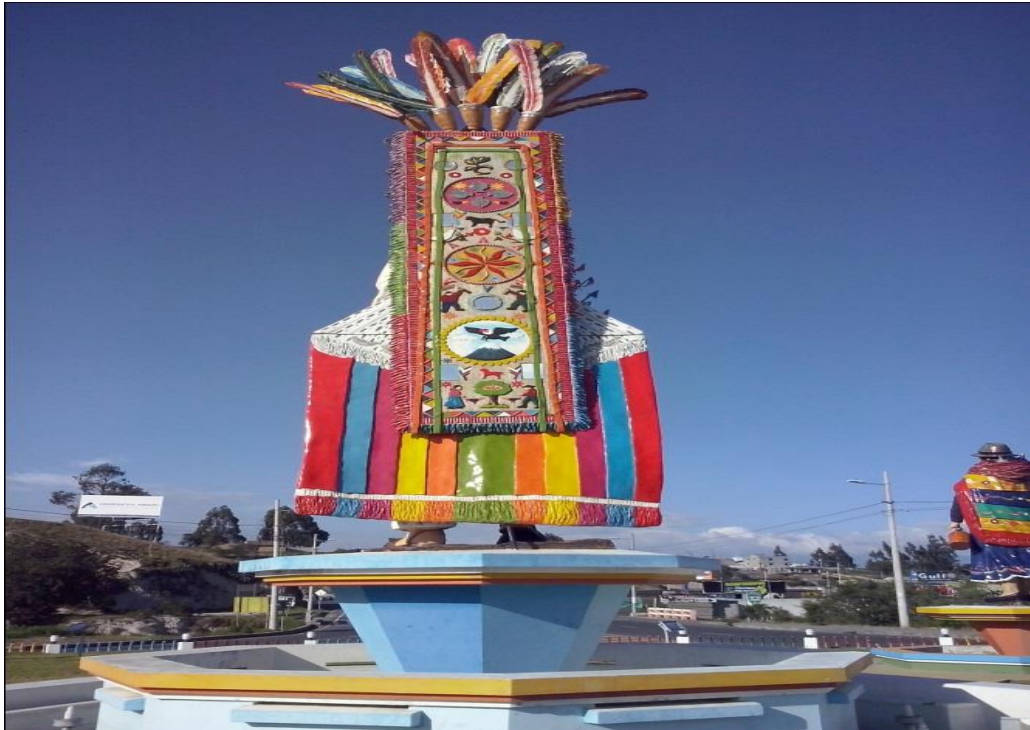
Fotografía N. 4