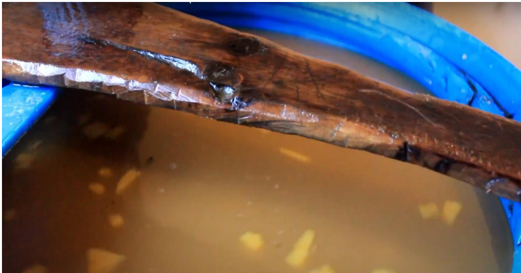
Imagen 14. Cantineros

Son personas quienes están al pendiente de que no se agote el licor que llevan a los personajes, tienen la misión por decir así de proveer con líquidos para que estos brinden a los espectadores, conocidos y entre ellos, entre la principal bebida esta la chicha, el puro, vinos, entre otros.