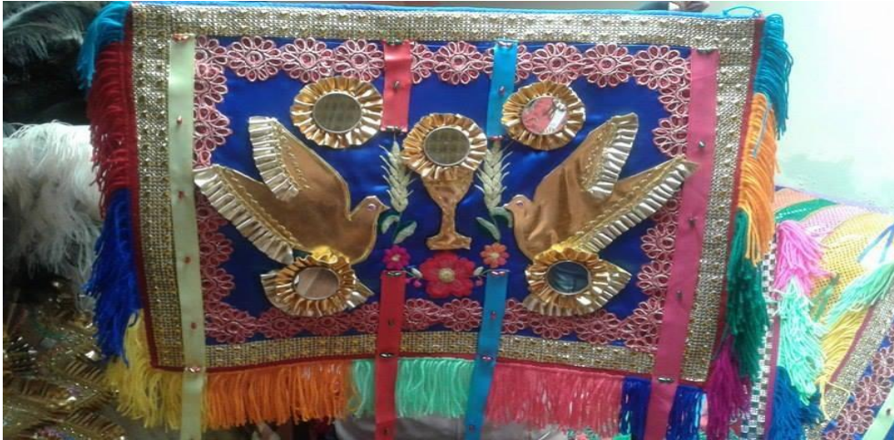
Imagen 6. Delanteros de los danzantes

Este es colocado en la parte delantera inferior tiene una forma cuadrangular muy llamativa ricamente bordado y decorado con espejuelos redondos u otras formas, representa motivos eclesiásticos en el centro lleva un cáliz que significa la eucaristía dos palomas que simbolizan el espíritu santo los bordes son decorados con flecos de distintos colores.