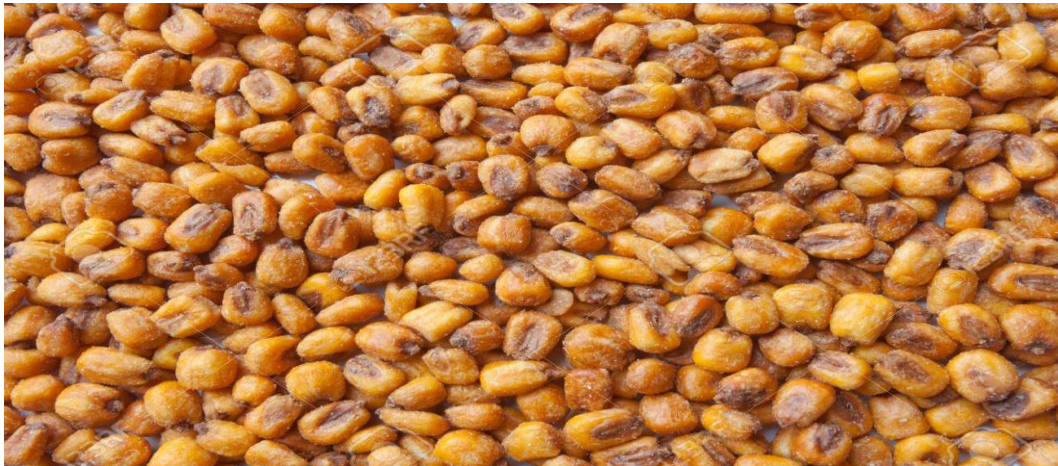
Imagen 19. Maíz tostado.

Inca. Dada su calidad oficial, además de sus esposas, de los sacerdotes y soldados, debió, en su corte, contar con un huaycuy camayoc o cocinero. Este, con muchas ayudantes, seleccionaba el mejor maíz para el tostado.