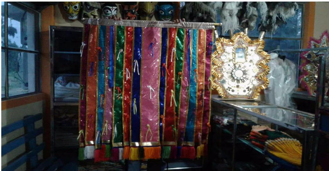
Imagen 9. Bandas del danzante.

Estas franjas representan el color del arco iris, las mismas que constan de siete colores como el rojo, naranja, amarillo, verde, celeste, azul, y violeta que caen desde los hombros hasta la altura de los pies.