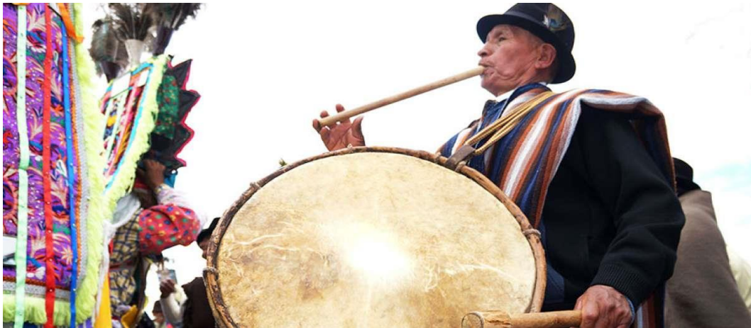
Imagen 13.El tamborero.

Personaje quien da el ritmo para que el danzante ejecute su baile, este lleva consigo un tambor y un pingullo de donde deriva su nombre tambonero-pingullero, estos instrumentos que son muy propios de la serranía Ecuatoriana datan desde la antigüedad llegando a conocerles como milenarios, en la actualidad ha sido remplazado con las bandas de pueblo que buscan de alguna manera representar el ritmo autóctono del danzante.