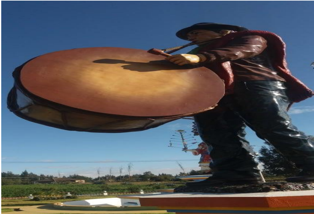
Fotografía N. 8