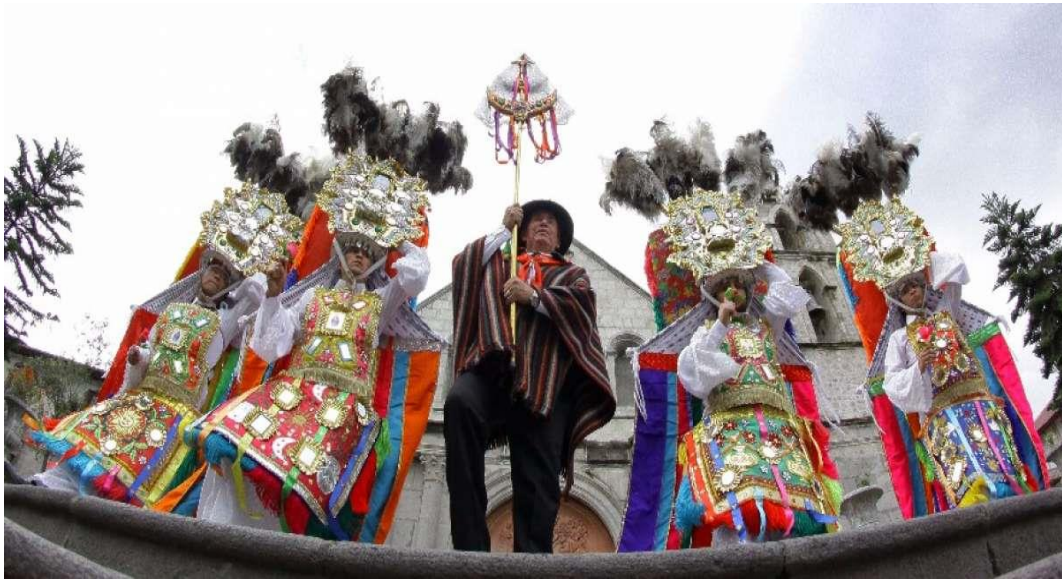
Imagen 12. El prioste.

Este personaje quien ocupa el primer lugar en la fiesta del danzante, va acompañado por su esposa, y familia; en sus manos lleva un guion.