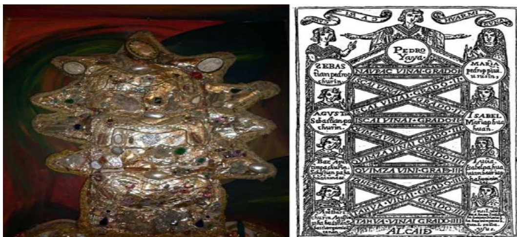
Imagen 2. El cabezal

Como presenta la siguiente imagen del: Tocado antiguo (siglo XIX) de un danzante de Pujilí (Colegio Pedro Vicente León, Latacunga). Diagrama genealógico de Juan Pérez Bocanegra.