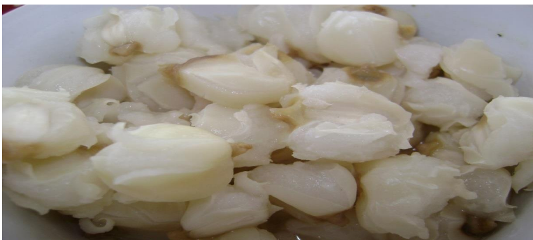
Imagen 17. Mote.

Es un alimento de los incas que data desde los años 1590, era considerado como fuente de alimentación y energía, este es un derivado del maíz mediante un procedimiento que se lo realiza con la ceniza para lograr su rompimiento de membrana y de esa manera su suavidad al momento de su cocción con el uso de leña. Como podemos observar en la siguiente imagen tomada de Wikipedia: