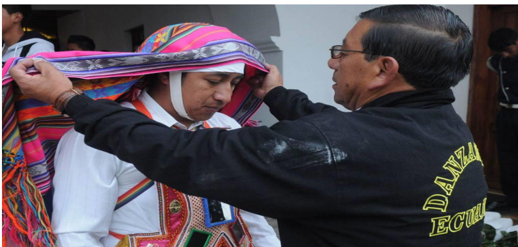
Imagen 4. Macana