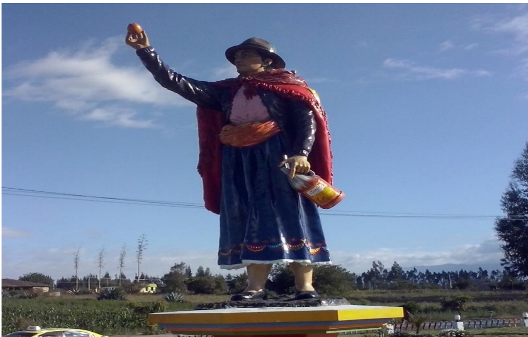
La Mama Danza