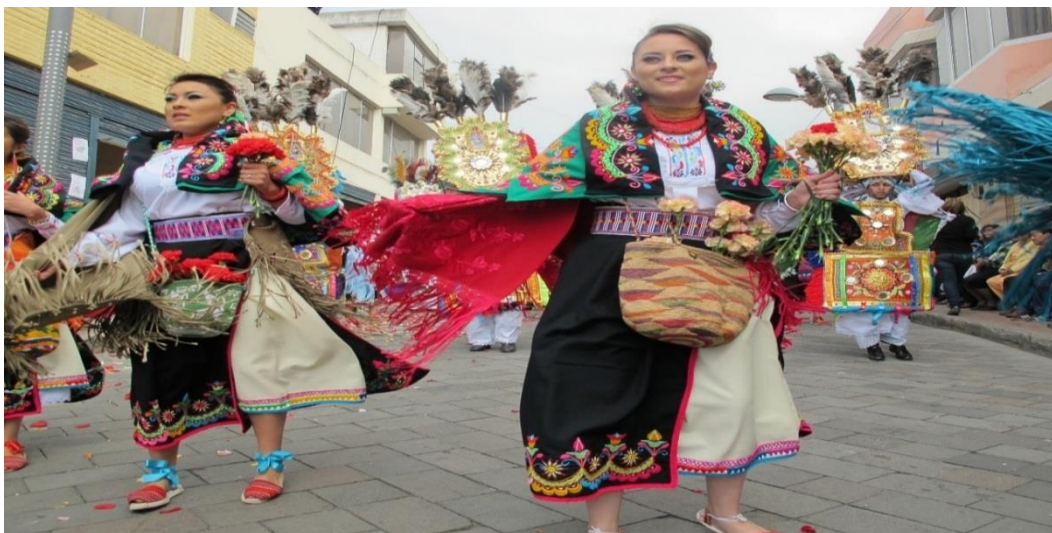
Imagen 10. La mamá danza.

Es la acompañante del danzante en el baile, quien le provee de dulce y agua para aumentar su energía, fuerza, la misma que viste un atuendo muy elegante y llamativo propio de la serranía ecuatoriana durante la fiesta, el mismo que consiste en aretes de diferentes colores y formas, llevan puestas binchas multicolores que simboliza la naturaleza, su cabello es envuelto en cintas coloridas que representan el arco iris.