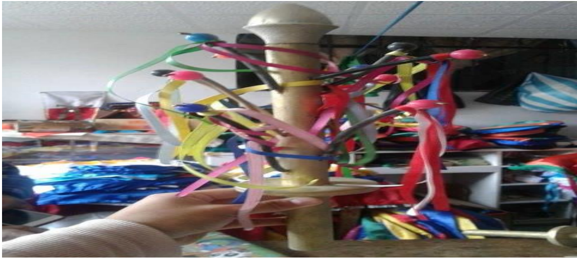
Imagen 3. El Alfanje del danzante

Este es el símbolo de poder sacerdotal, está construido de madera tiene una forma cilíndrica en el que va incrustado unas piezas de hierro y cintas de colores que significan las hojas de la planta de maíz, el mismo que solo puede ser utilizado por el sacerdote de la lluvia o danzante al ser un objeto sagrado cuyo fruto que fue venerado por ser el principal alimento dentro de la cultura inca.