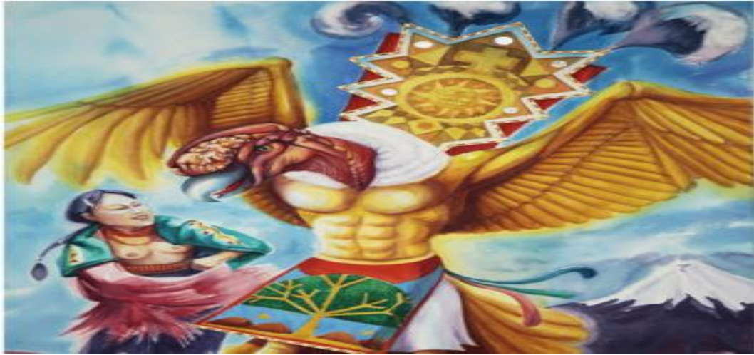
Imagen 1. El baile

Como, presenta en la siguiente imagen del pintor Joe Alvear.