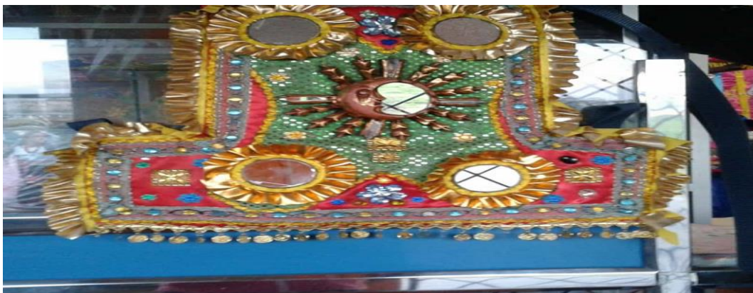
Imagen 7. Pechera de los danzantes.