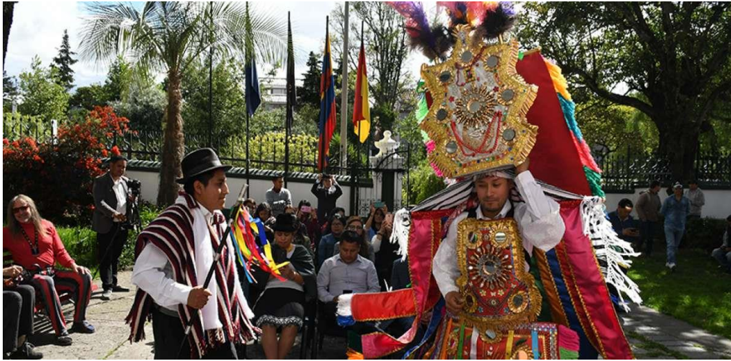
Imagen 11. El alcalde.

El Alcalde personaje quien organiza el Inti Raymi o fiesta del Sol, mediante préstamos o jochas, pide favores a familiares, vecinos y amigos, busca a quienes le puedan ayudar con la organización de la celebración, es el que está encargado de celebrar las diferentes fiestas del año como carnaval, navidad, entre otras.