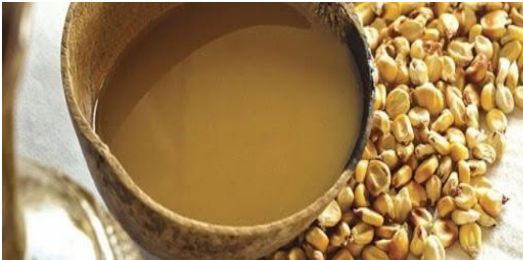
Imagen 16. Chicha de maíz.

Según la Real Academia Española (citado en Wikipedia, 2019): “la palabra chicha proviene de la lengua indígena kuna, de Panamá: chichab, que significa 'maíz'.” (párr.3)