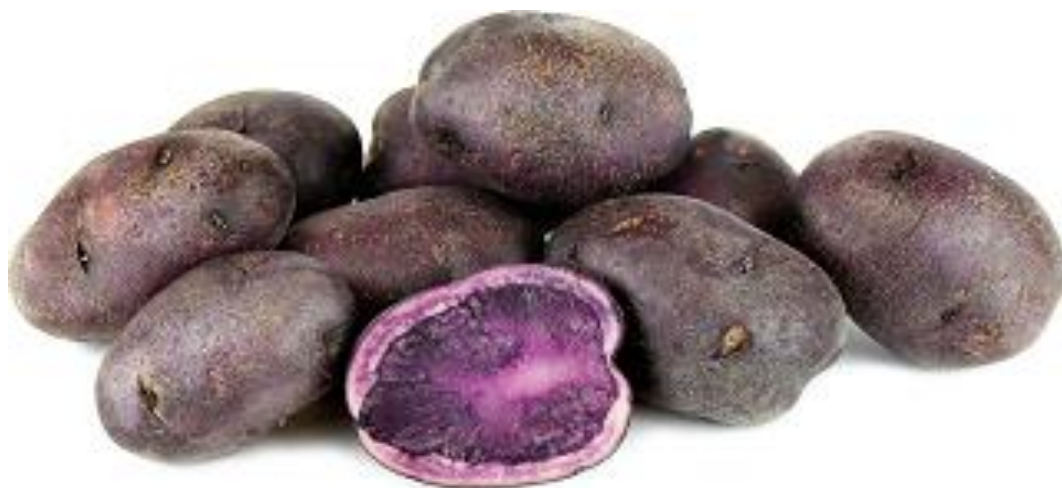
Imagen 18. Papas moradas - EcuRed

Las papas de los incas eran de color morado, misma que es una muy buena fuente de energía, tiene propiedades antioxidantes, nutrientes, vitaminas entre otras. Era cultivada en los andes pese a los accidentes geográficos que existe, utilizaban terrazas para su cultivo. Como podemos observar en la siguiente imagen de EcuRed: