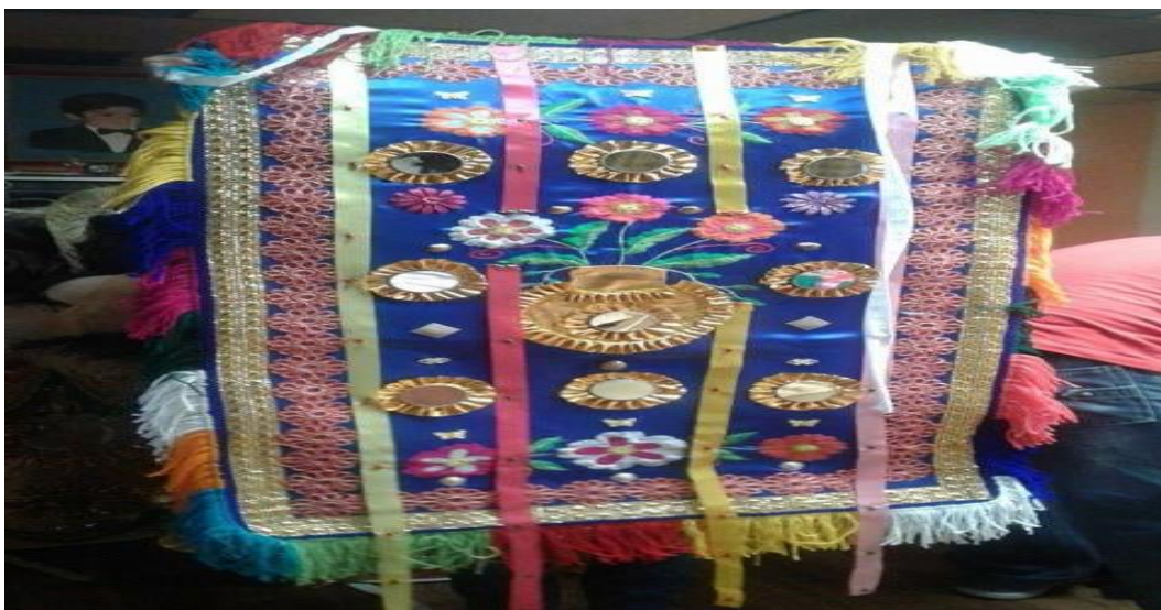
Imagen 5. Espaldares de los danzantes

Este es un elemento de suma importancia y gran tamaño dentro de la vestimenta del danzante el mismo que cubre toda la espalda, está confeccionado de forma rectangular decorado con una amplia gama de colores, una rica variedad en sus bordados, encajes, mullos, flecos los mismos que tienen una representación religiosa como también busca representar la pacha mamá mediante las flores al ser estas una ofrenda.