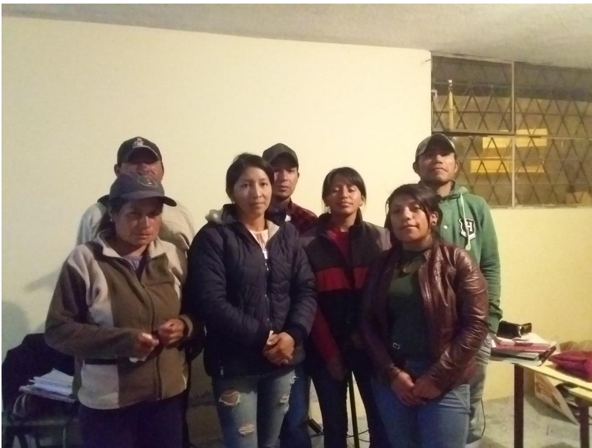
Ilustración 5: Participantes del grupo focal