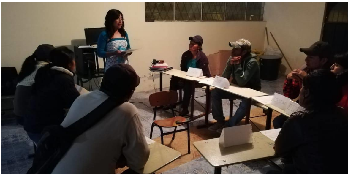
Ilustración 1: Inicio del grupo focal