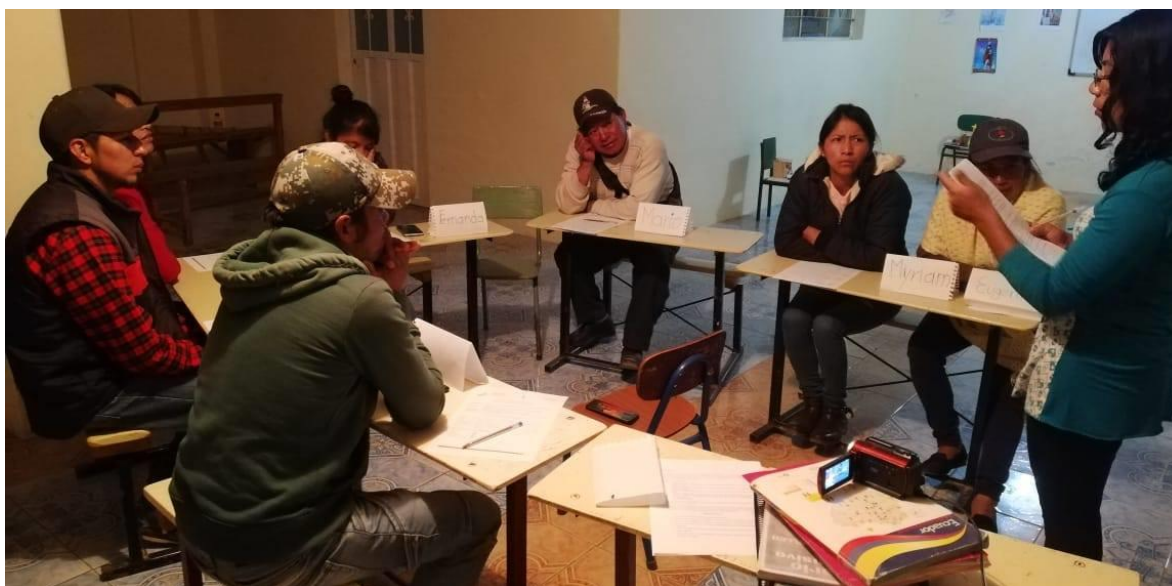
Ilustración 2: Entrega de fichas