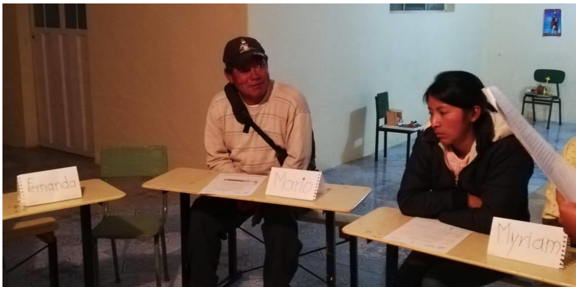
Ilustración 3: Información del grupo focal