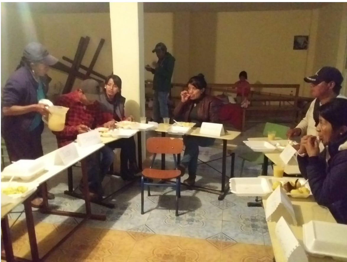
Ilustración 7: Agradecimiento a los participantes