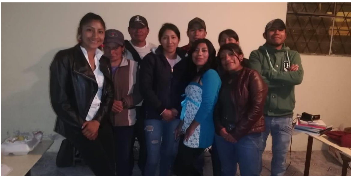
Ilustración 6: Finalización del grupo focal