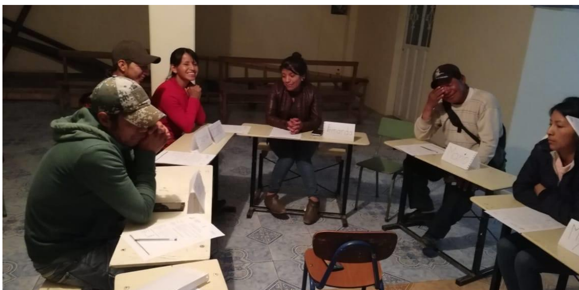
Ilustración 4: Intervención de los participantes