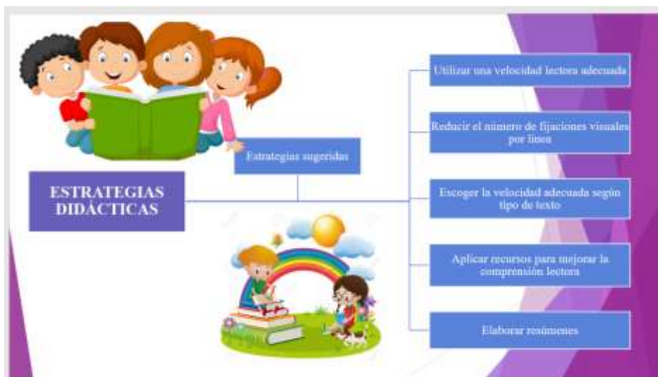
Figura 3. Socialización de la propuesta Elaborado por: Alexandra Cunuhay Pastueña