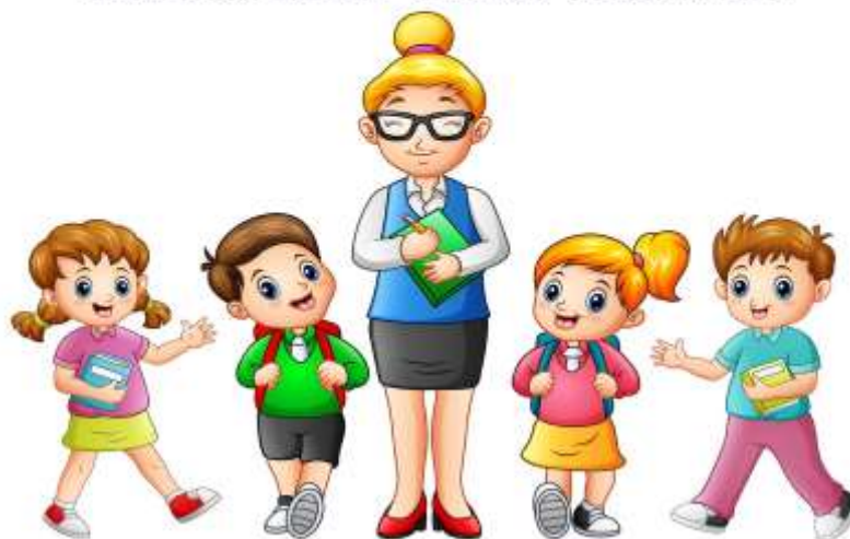
Figura 1. Motivar a los estudiantes a la lectura

Vive agradecido de tener un trabajo donde tus alumnos te obligan a aprender diariamente algo nuevo, incluso a sonreír cuando estás triste.