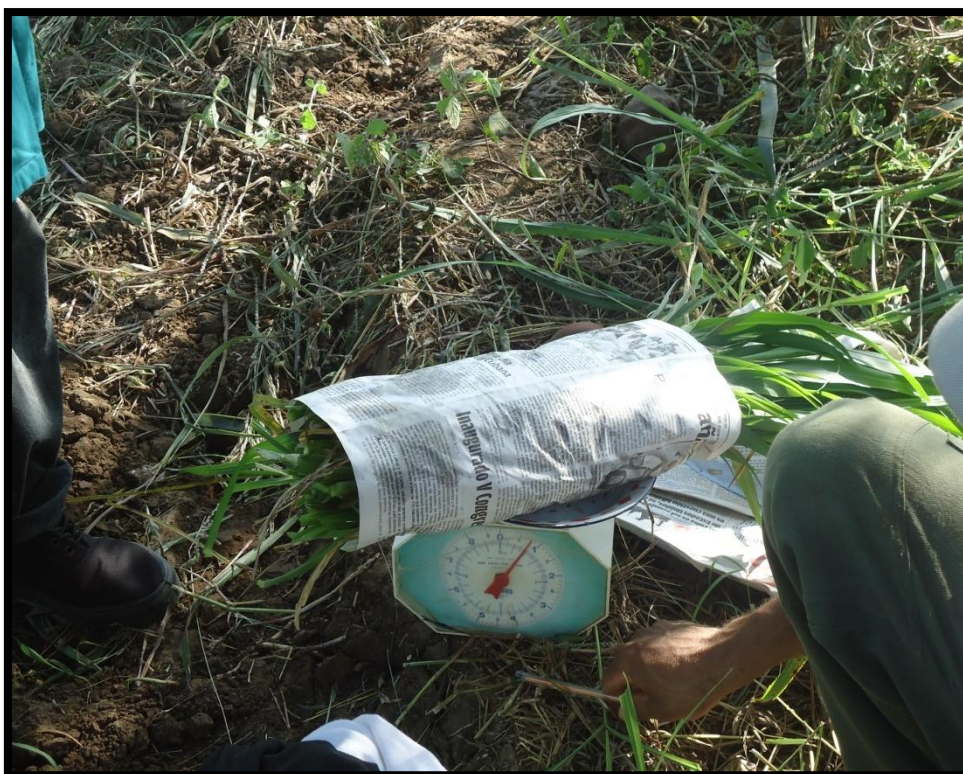
Pesaje de Muestras