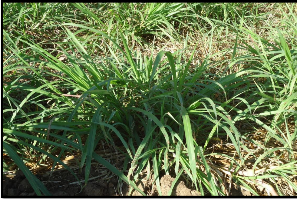
Pennisetum purpureum vc. CT. 169