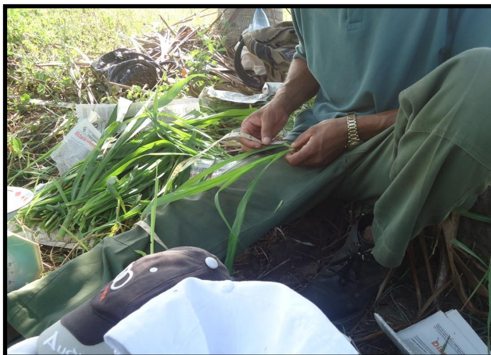
Medición de la Materia Verde (hojas, tallos, Vaina)