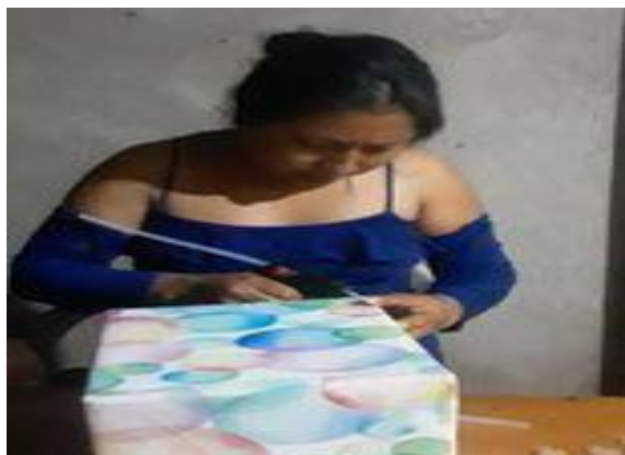
APENDICE 3. Elaboración del material didáctico las burbujas saltarinas.