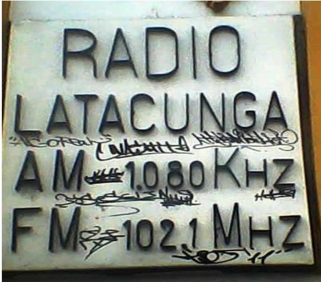
Sistemas de comunicación Latacunga