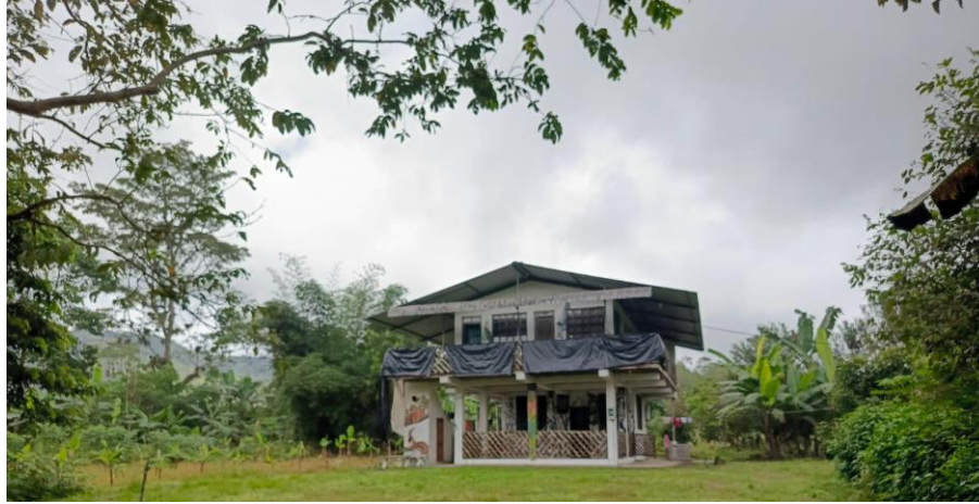
Figura 6. SACHA WASI.