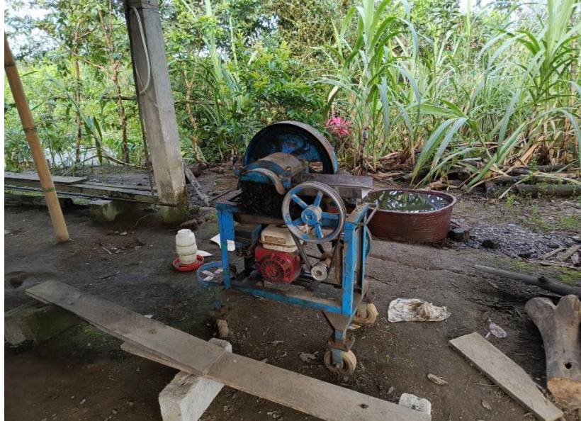
Figura 5. Trapiche.