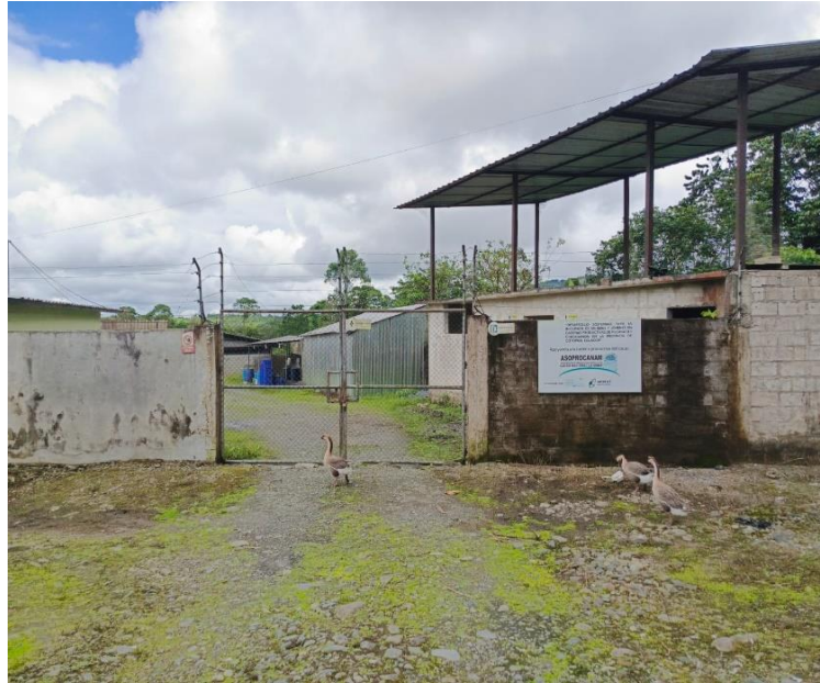
Figura 4. ASOCROCANAM