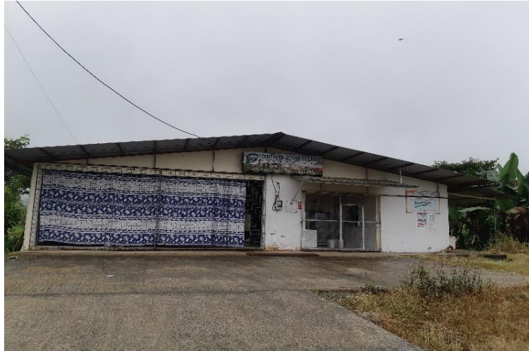
Figura 2. Centro de Acopio ASOPAGUA.