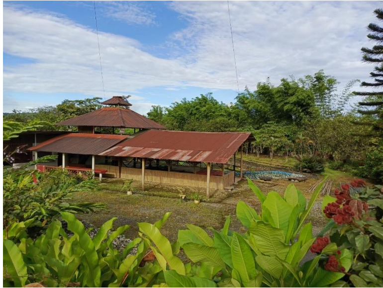
Figura 3. Complejo Turístico MAHO.