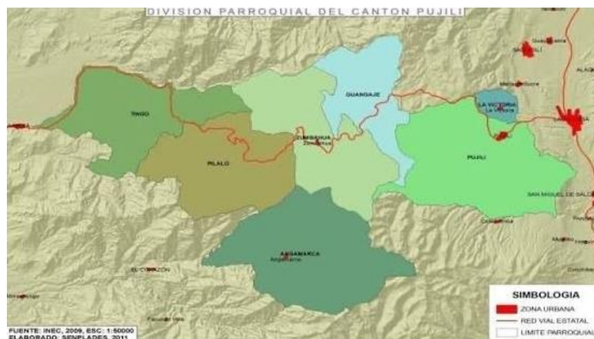
Figura 2 Mapa político del Cantón Pujilí