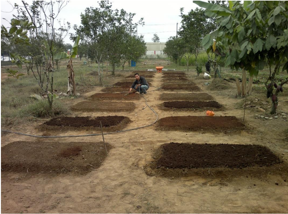
FOTO 5. IDENTIFICACIÓN DE LAS PARCELAS EXPERIMENTALES