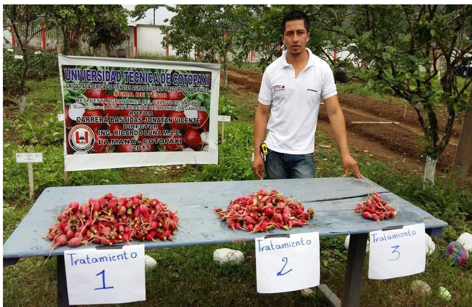
FOTO 10. RÁBANO COSECHADO POR TRATAMIENTO