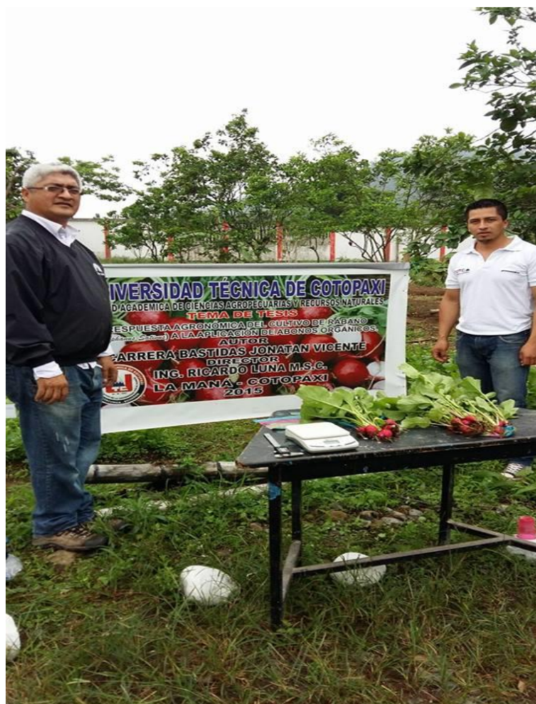
FOTO 9. COSECHA CON EL DIRECTOR.