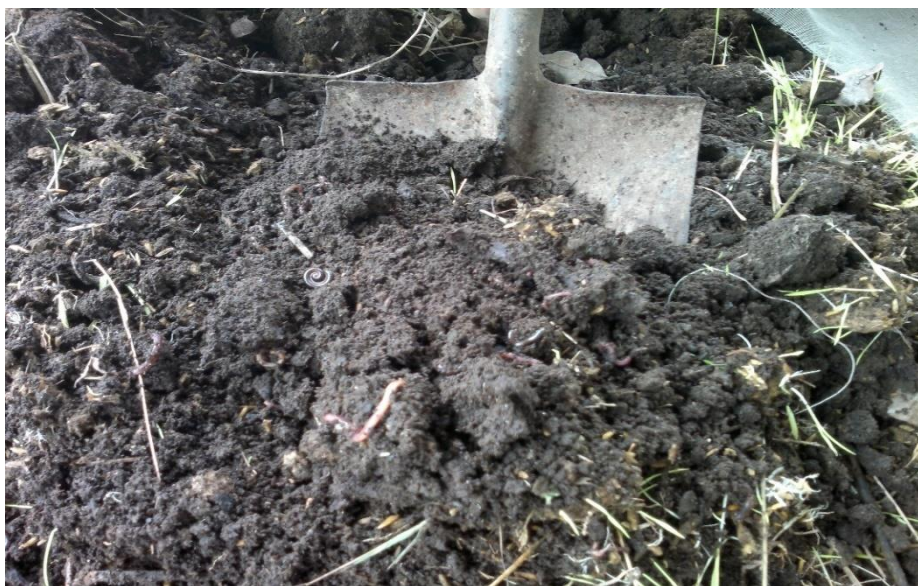
FOTO 2. PRODUCCION DE ABONO CON RESIDUO VEGETAL