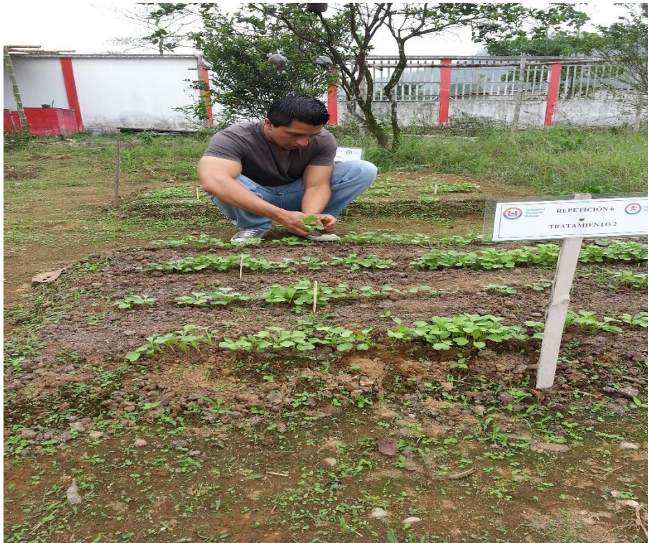
FOTO 6. SELECCIÓN DE PLANTAS. .