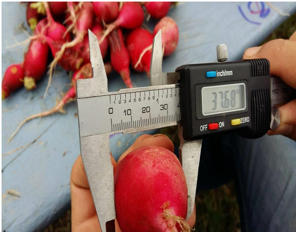
FOTO 10. DIÁMETRO DE BULBO DE RÁBANO