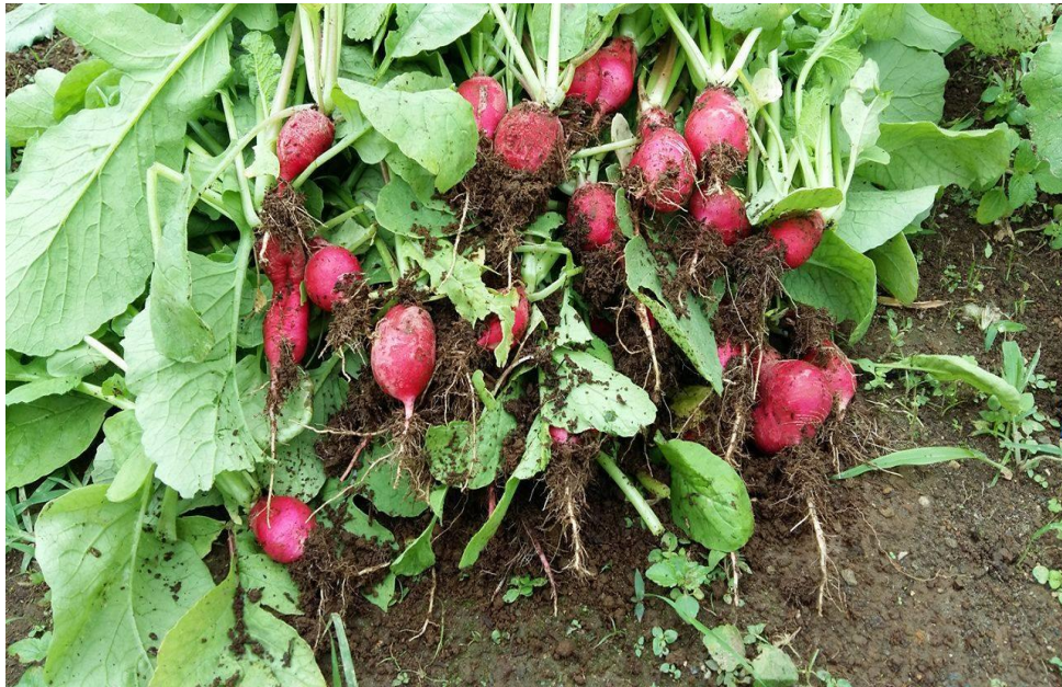
FOTO 9. COSECHA DE RÁBANOS