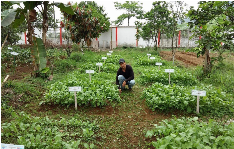
FOTO 7. CONTROL DE MALEZAS.