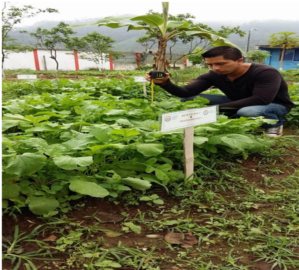
FOTO 8. TOMA DE DATOS DE ALTURA DE PLANTA