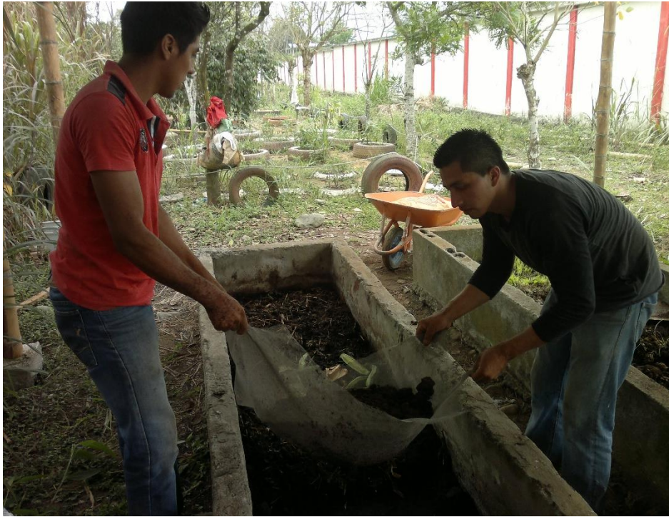
FOTO 3. PREPARACION DE ABONOS