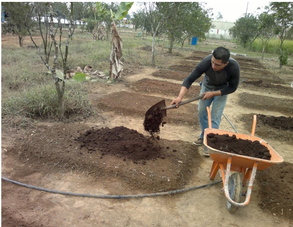
FOTO 4. INCORPORACION DE ABONOS EN LAS PARCELAS