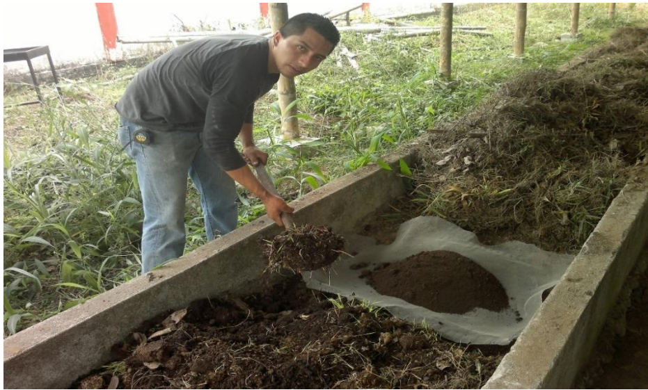
FOTO 1. ELABORACIÓN DE ABONOS CON RESIDUO ANIMAL.