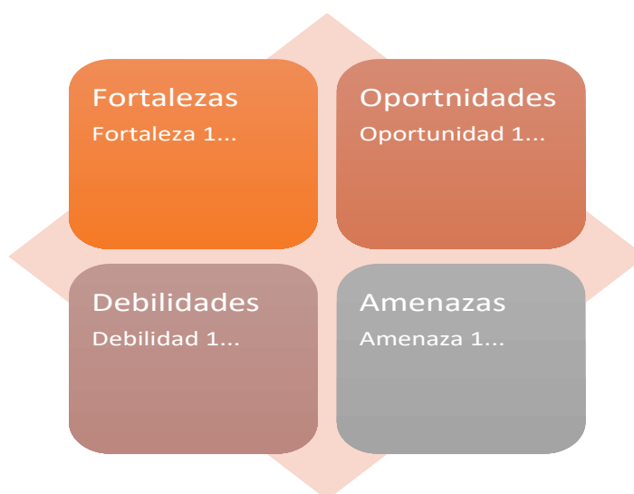
Figura 1. Esquema de Matriz FODA

En conjunto, la investigación aplica un enfoque cualitativo orientado a analizar y comprender la realidad turística de la parroquia Mulliquindil mediante un diagnóstico situacional. Su propósito es identificar elementos clave para un plan estratégico de desarrollo turístico sostenible, promoviendo un turismo responsable que contribuya al crecimiento social y económico de la comunidad.