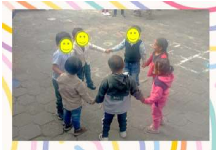
Juego de la Ronda