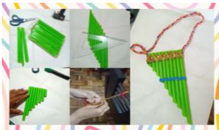
Proceso de elaboración de la zampona