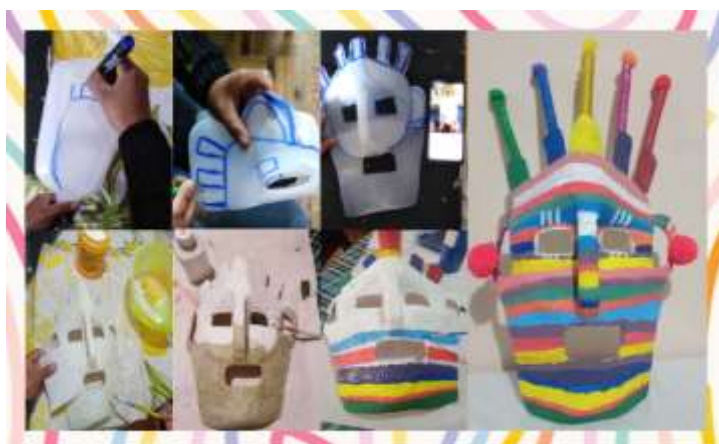
Proceso de elaboración de la máscara del Diablo Huma