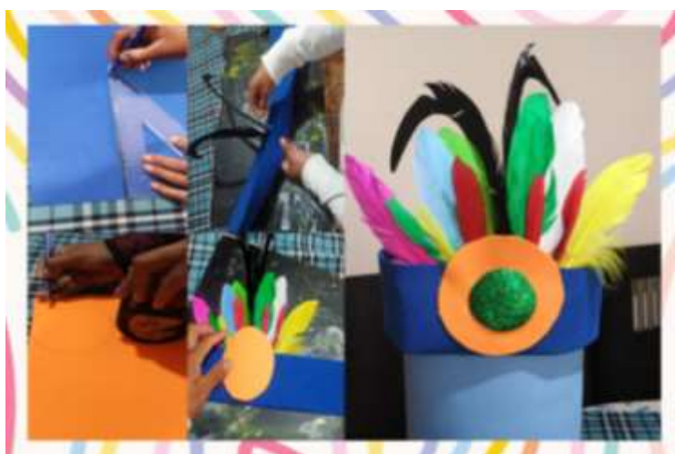
Proceso de elaboración de Corona de plumas (Tawashap)