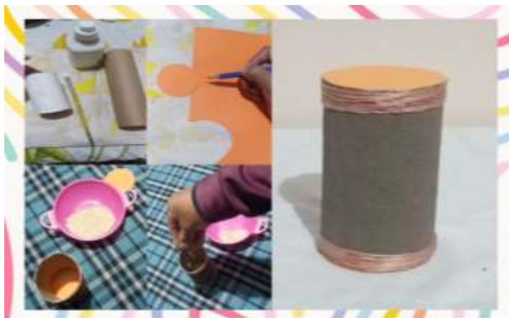
Proceso de elaboración de la guasa