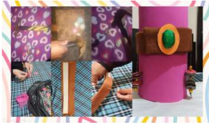
Proceso de elaboración de la cinta en la cadera (Shakap)