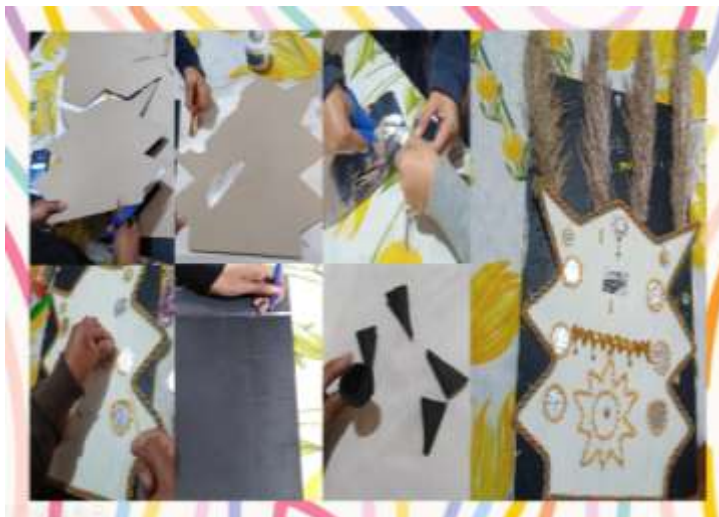
Proceso de elaboración del Cabezal del Danzante de Pujilí