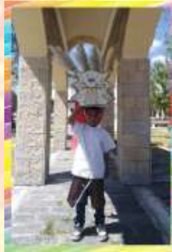
Cabezal Utecino Danzante