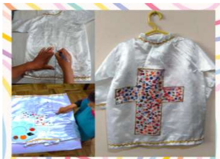
Proceso de elaboración de la Camisa con la Cruz Andina