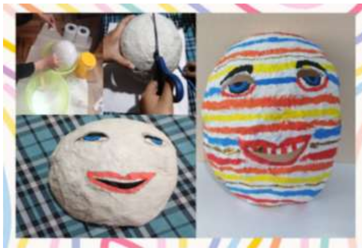
Proceso de elaboración de la máscara congelada