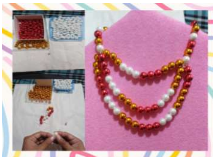
Proceso de elaboración del collar