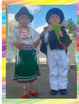
Figura 4 Joyitas Sonoras