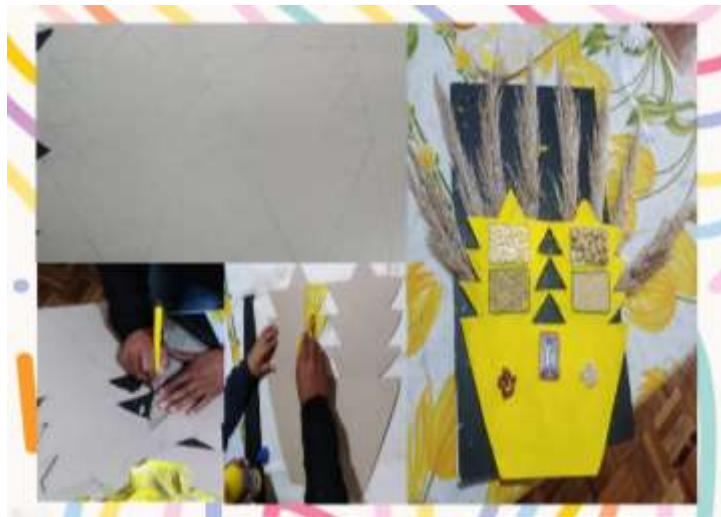
Proceso de elaboración del Cabezal del Danzante de Salcedo