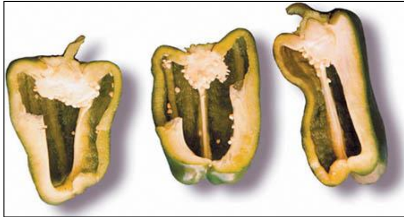
Figura 2. La madurez fisiológica del pimiento se alcanza cuando las semillas endurecen y la parte interna del fruto comienza a colorearse.