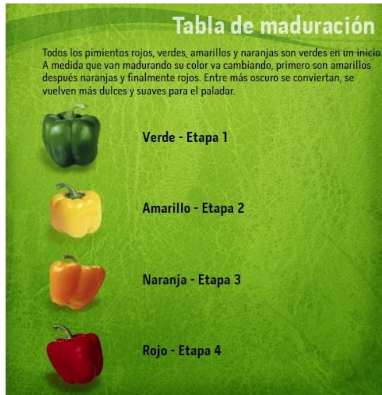
Figura N° 1. Tabla de maduración

En pimiento, cuando las semillas se endurecen y comienza a colorearse la parte interna del fruto.