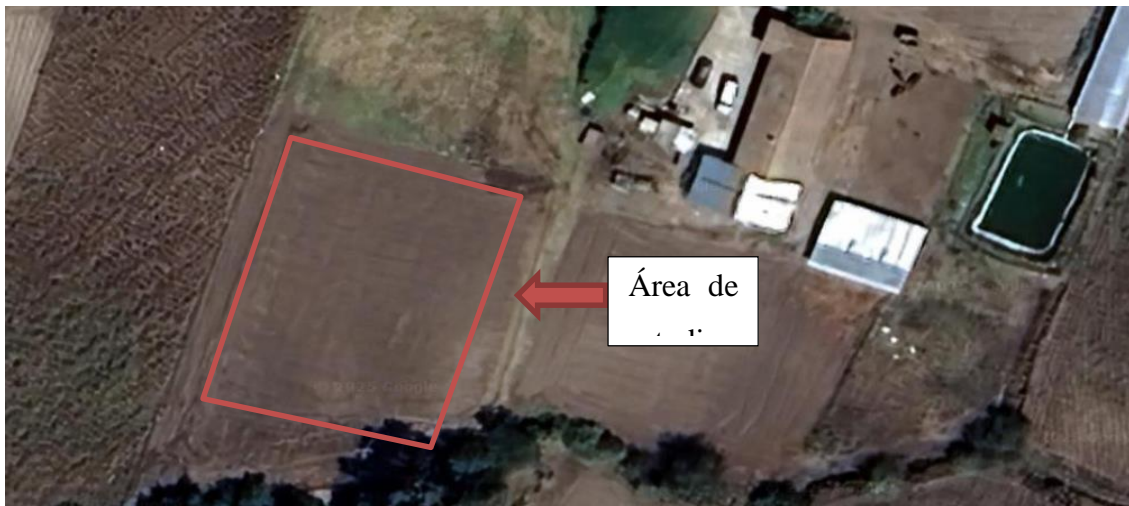
Imagen 1 Ubicación geográfica de la zona de estudio

La investigación se desarrolló en un sitio experimental previamente seleccionado, donde se realizó un diagnóstico de suelo con el fin de caracterizar las condiciones edáficas iniciales y asegurar la correcta implementación del ensayo. El experimento se estableció bajo un Diseño de Bloques Completos al Azar (DBCA) con arreglo factorial 2 \times 4 , considerando dos variedades de chocho (INIAP 450 e INIAP 451) y cuatro niveles de tratamiento, con el objetivo de evaluar su efecto sobre el comportamiento agronómico del cultivo. La distribución de los tratamientos se realizó mediante aleatorización, utilizando parcelas experimentales de 6 \times 6 m, lo que permitió reducir la variabilidad experimental.