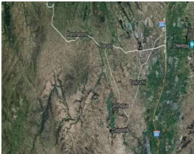
Figura 3. Mapa de área de investigación