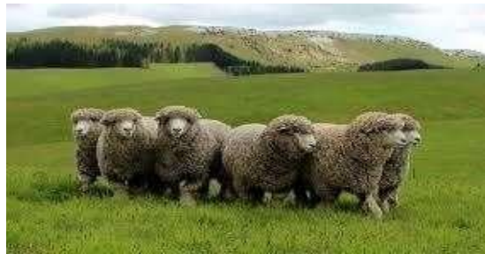
Figura 2. Ovino Corriedale