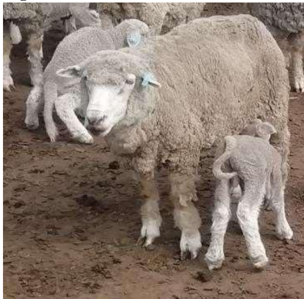
Figura 1. Raza 4M