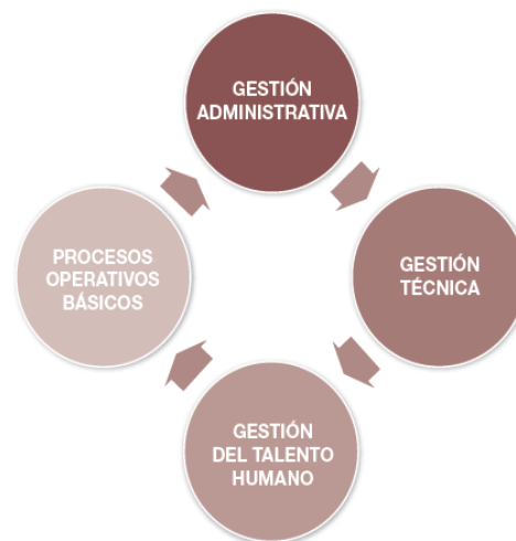
GRÁFICO 2: Estructura del SART - IESS

implementación con metodología específica, todo bajo responsabilidad del empleador. De la misma forma cómo funcionan las acreditadoras, el SART del IESS cuenta con su propio sistema de auditorías de verificación y conformidad, basada en No Conformidades, observaciones y mejora continua, para todas las empresas sujetas al régimen de riesgos del trabajo.