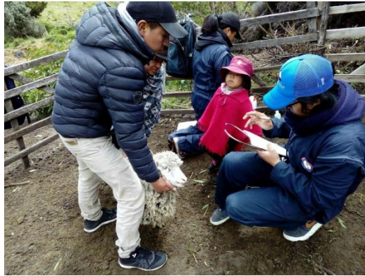
Encuesta sobre el sistema de tenencia