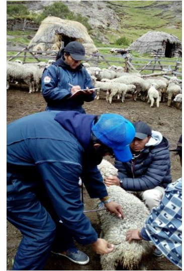
Largo de la grupa