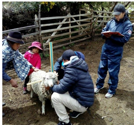
Alzada a la cruz