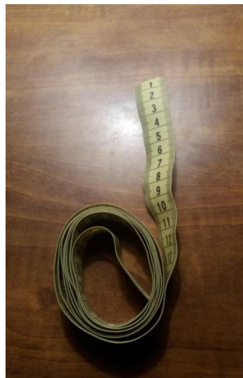
Cinta métrica inextensible