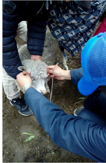
Ancho de la cara