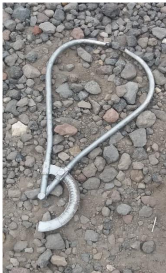
Compas de brocas