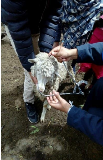
Largo de la cabeza